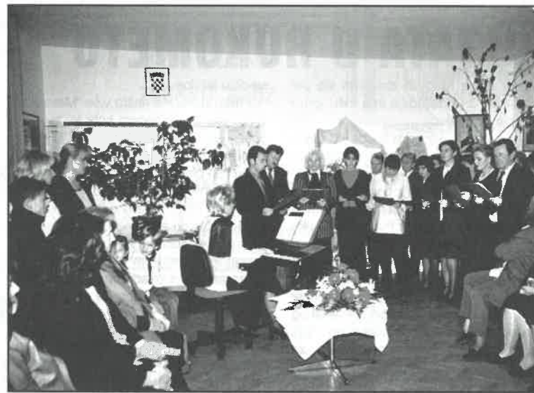
Izložba je započela pjesmom grupe dugoselskih pjevača

bila nadasve edukativna nisu bili mogući organizirani posjeti učenika u pratnji učiteljica za vrijeme nastave, jer su je učenici mogli pogledati samo nedjeljom u pratnji roditelja, što je bila rijetkost.