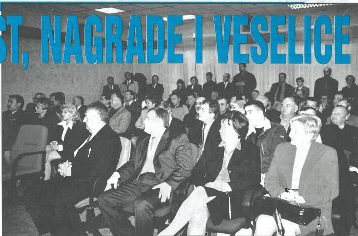
Vijećnici i gosti na svečanoj sjednici Gradskog vijeća prigodom Dana grada Dugog Sela

Jesenske svetkovine upotpunili su i drugi događaji: izložba jesenskih plodova i zimnice u organizaciji kluba umirovljenica, izložba i nastupi KUD-a "Preporod", susret u uredništvu "Dugoselske kronike" prigodom 400. broja, tradicionalni teniski turnir "Martin Breg - open" i druga događanja koja smo zabilježili u reportažama na stranicama 2., 6. i 7., te 12. ovog broja "Dugoselske kronike".