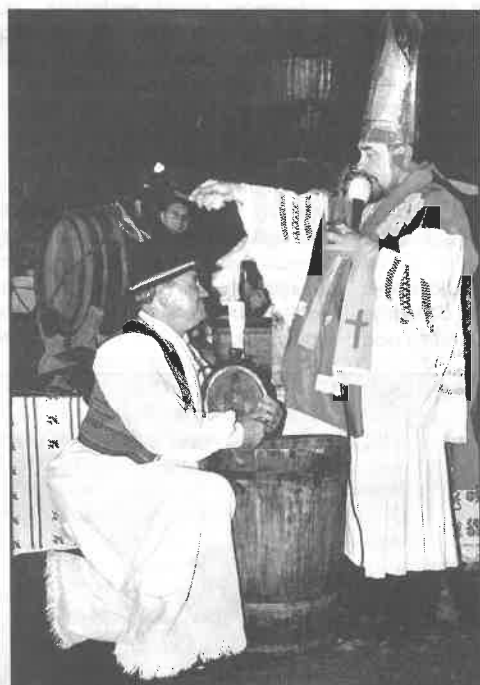
Obred krštenja u izvedbi Preporodaša i dr. Pepelnjaka kao jedinstveni tradicijski običaj lišen komercijalizacije, posjetitelji su pratili sa zanimanjem

Uvečer 10. studenoga, mjeseca kojeg u narodu zovu još veternjakom, nije moguće zaobići prostor na vrhu