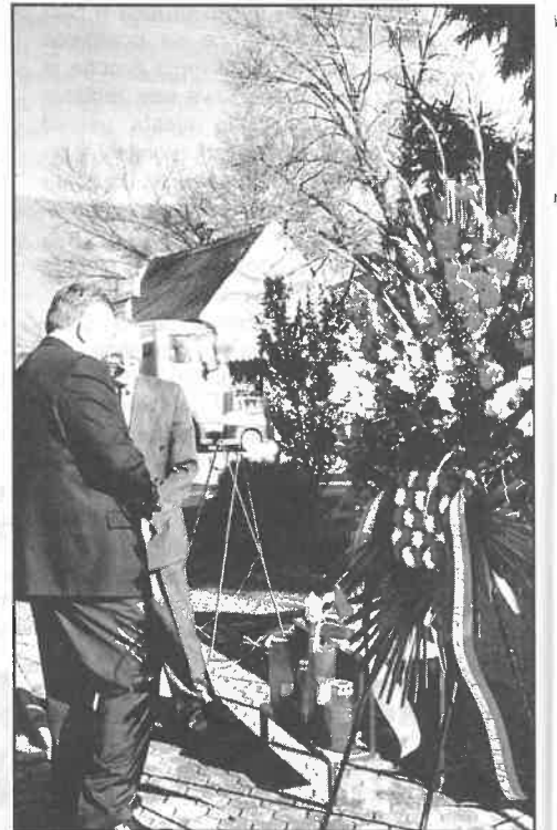
Za Dan grada položeni vijenci i zapaljene svijeće u spomen na poginule branitelja

- Premali kapaciteti dječjeg vrtića i osnovne škole zabrinjavaju. Dogradnjom dječjeg vrtića stanje je ublaženo u predškolskom odgoju. Srednjoškolci će uskoro dobiti školski prostor za obrazovanje koji grade zajedno ministarstvo, županija i grad. Taj bi objekat privremeno mogao riješiti