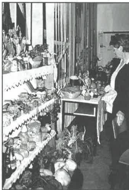
Plodovi dugoselske jeseni u svježem i na prirodan način konzerviranom obliku

Najveći i jedini nedostatak ove izložbe jest to što je trajala praktično samo jedan dan - posljednju nedjelju u listopadu. Razlog je tome nedostatak prostora odnosno previše korisnika jedine društvene prostorije u Narodnom sveučilištu za takvu namjenu. Izložbenu postavu valjalo je ukloniti kako bi se redovne aktivnosti nastavile ponedjeljkom. Iako je izložba