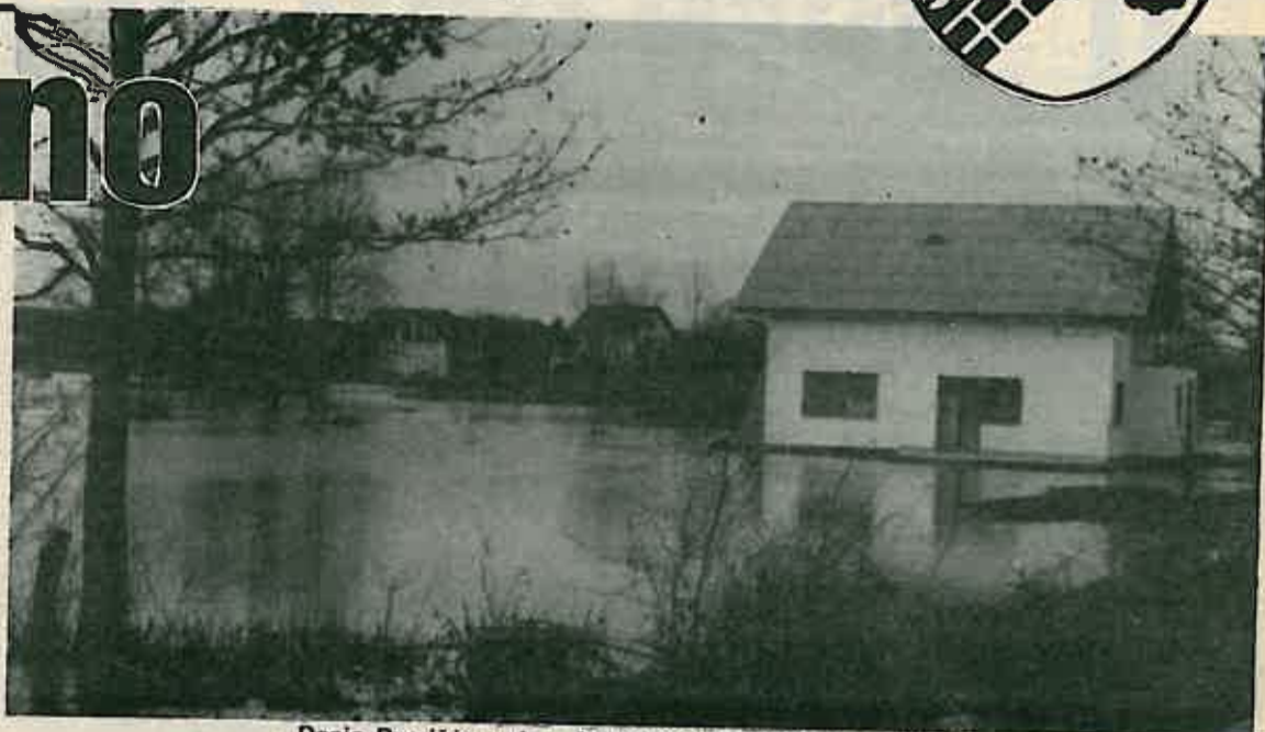
Donje Dvorišće, nakon što se voda povukla 20 centimetara

Takva poplava, ili čak većih razmjera, može se ponoviti, zapravo već sutra: sve dok ne bude uređena dolina rijeke Zeline uzvodno od Božjakovine. To uređenje je u programu Republičke vodoprivredne interesne zajednice. Koliko je hitno i nužno ostvariti taj dio programa najbolji i najuvjerljiviji je dokaz ova poplava, treća u posljednje dvije godine. Izvršno vijeće će ovih dana zatražiti od te RVIZ da što prije, zapravo odmah pristupi realizaciji uređenja korita Zeline. Taj zahvat će sigurno manje koštati, nego li «koštaju» štete učinjene stalnim plavljenjem ovog područja.