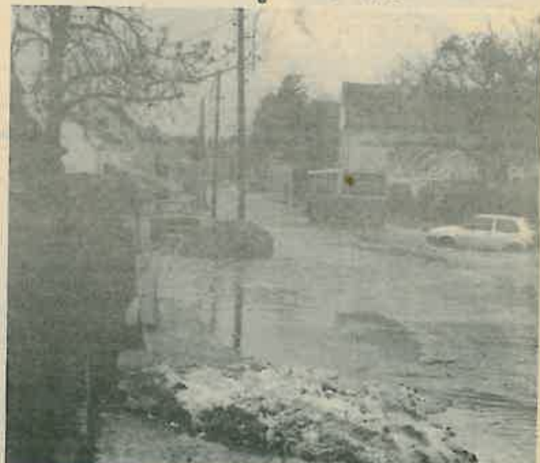
Voda je pljuštala na sve strane