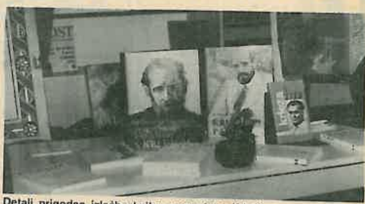
Detalj prigodne izložbe knjiga posvećene Krleži