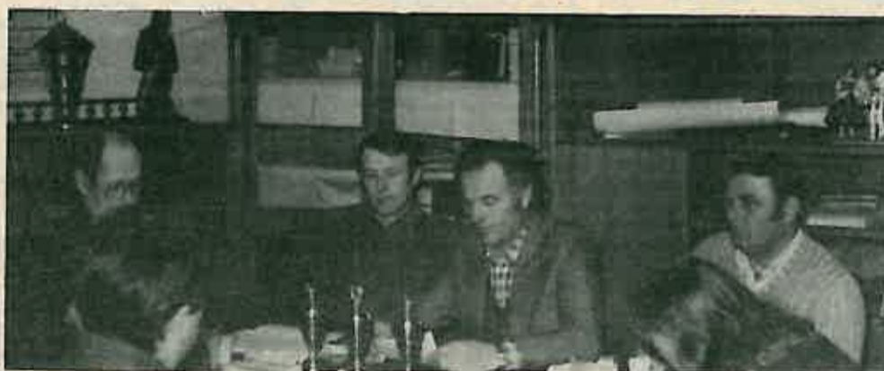
Sa Skupštine Kluba uzgajivača golubova