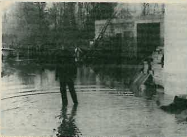
U sjevernom dijelu Božjakovine kretati se moglo samo u čizmama

Uz Dan zaštite spomenika kulture – 20. veljače