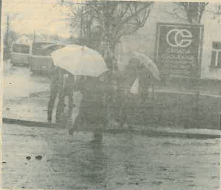
Kako prijeći a ne okupati se u vlastitim cipelama?

S obzirom na godišnje doba možemo veoma skoro ponovo očekivati istu sliku na našim ulicama. Zbog toga već sada nabavite gumene čizme.