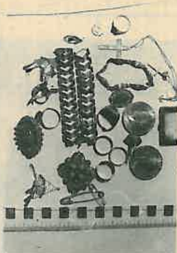
Dio ukradenog zlatnog nakita