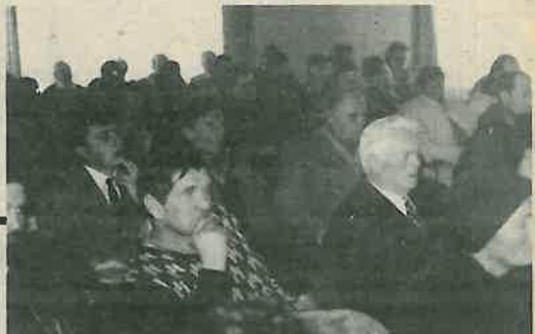
Sa Skupštine sportskog ribolovnog društva

Predsjedništvo je uvelo i neke novine: uvelo je evidenciju dolaska na radne akcije, suradnju sa ZSRD, anketiranje članstva, izradu nove dokumentacije i drugo. Posebno je značajno pokretanje aktivnosti oko provođenja odluke suda iz Siska po kojoj naše društvo treba dobiti znatna financijska sredstva na osnovu zagađivanja Save. Sa Vodoprivrednom organizacijom iz Dugog Sela postignut je