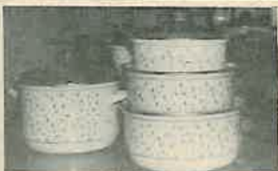
JEDAN OD PRIHVACENIH DEKORA