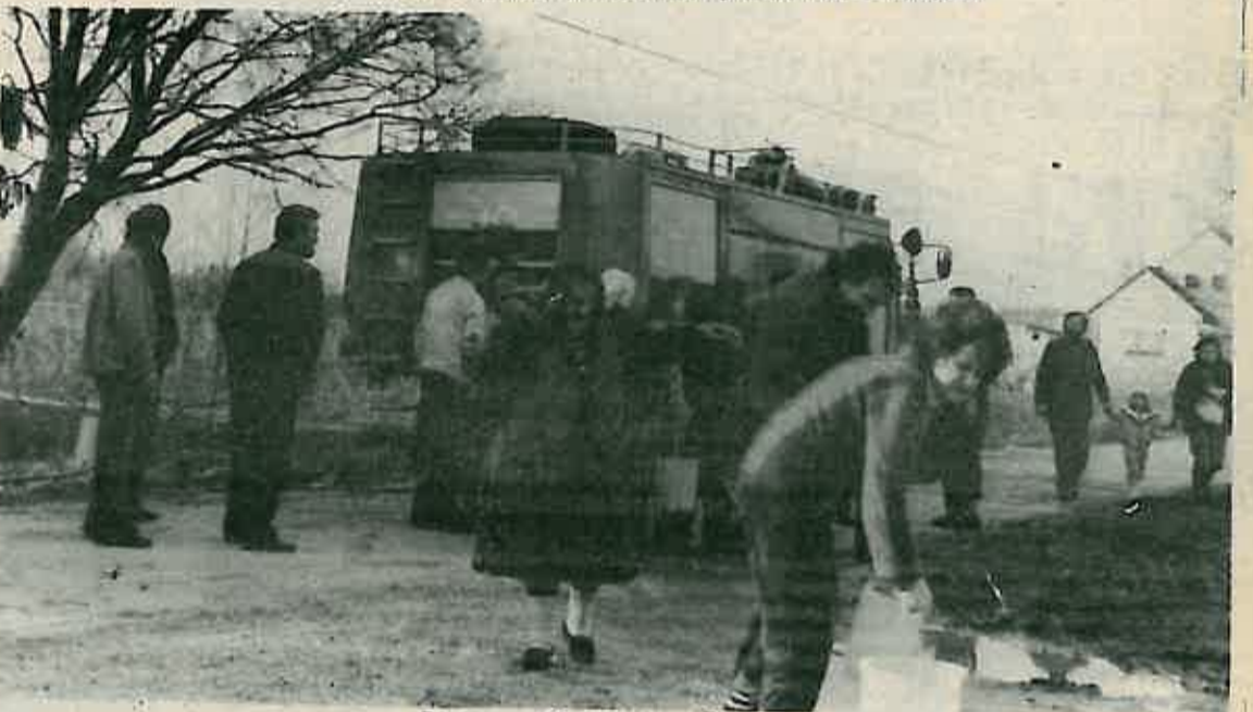
Doprema pitke vode u cisternama