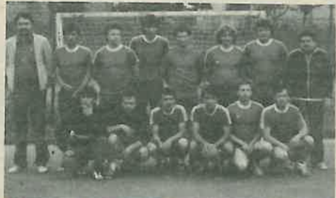
RK »Polet« iz Stančića