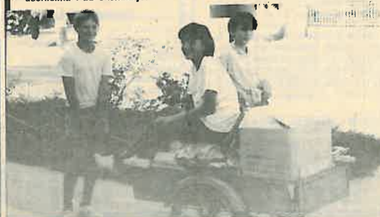
Revni sakupljači papira