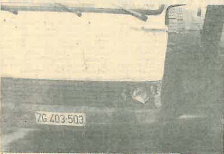
Oštećeno vozilo — dokaz krivnje nesavjesnog vozača

Krivac nesreće, u to ne treba ni sumnjati, sigurno bi bio pronađen, makar i koji dan kasnije. No pomoć, pravu ljudsku humanu, koju je pružio šef voznog parka, iskazuje visok stupanj njegove društvene svijesti i odgovornosti, što može poslužiti samo kao primjer svim ostalim našim građanima. Zapravo je šteta što takvih odgovornih i savjesnih građana nema više — tada bi bila i jača društvena samozaštita i veća osobna sigurnost naših građana.