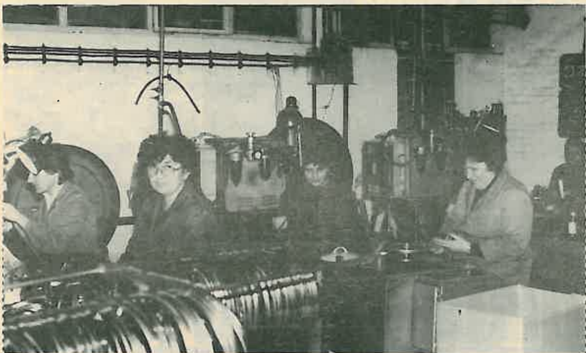
Proizvodnja prstena za »Rekord« posude

Tržište Engleske, zahvaljujući dobrim poslovnim odnosima, obogaćeno je novim dekorima naših proizvoda. Na izložbenom sajmu u Birminghamu (1.-5. veljače 1987.) novi, usvojeni dekori »goričinog« posuda izazvali su pažnju i interes posjetitelja. Ovom činjenicom povećavamo izvoz na obostrano zadovoljstvo. Možemo li učiniti više u izvoznim planovima i u druge dijelove svijeta?