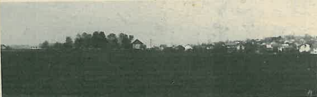
Južna padina brežuljka pored Brckovljana – idealna lokacija za novu školu