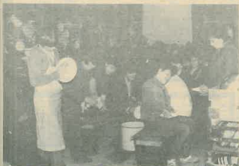
Usvajanje prvih radnih navika

Zadovoljstvo se oslikava u osimna iscenika - radnika. A kako i ne bi. Trudnjaci se kao prvi radnici, osigurani im je topli obrok, a i za svoj rad primiti će odgovarajuću naknadu, odnosno osobni dohodak. Individualno, stekli su još možda i prva saznanja, to vidjeti da lanac i nije tako lako proizvesti. Možda će vrijeme provedeno u radu u našoj tvornici motivirati nekoga od njih da i sam postane metalac, emaljirac, dizajner. Možda će željeti u našoj tvornici ponuditi neki drugi lonac. Napokon, u tvornici danas nalazimo podosta radnika i stručnjaka koji su kao učenicima ove škole, sa više ili manje znatije, upoznavali naš proces proizvodnje.