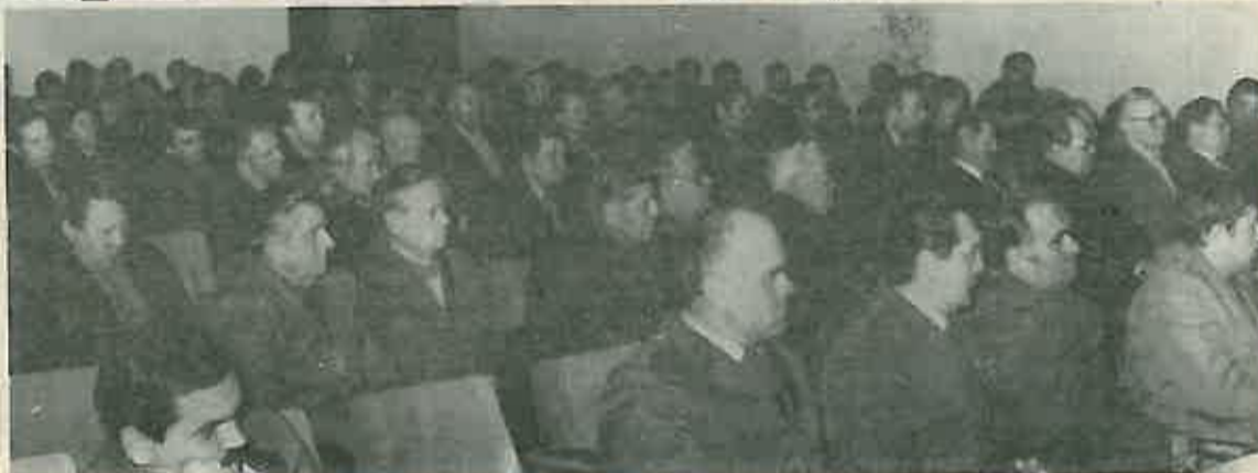
Primjetno zanimanje i veliki broj slušatelja na oba predavanja

Radi ilustracije, predavač je završio svoje izlaganje slijedećom metaforom: »Jugoslavija je veliki laboratorij društvenih istraživanja u kojem, kao i u svakom drugom laboratoriju ima uspjeha i neuspjeha. Međutim postignuti uspjesi prelaze značaj tog laboratorija i imaju znatno širu primjenu.«