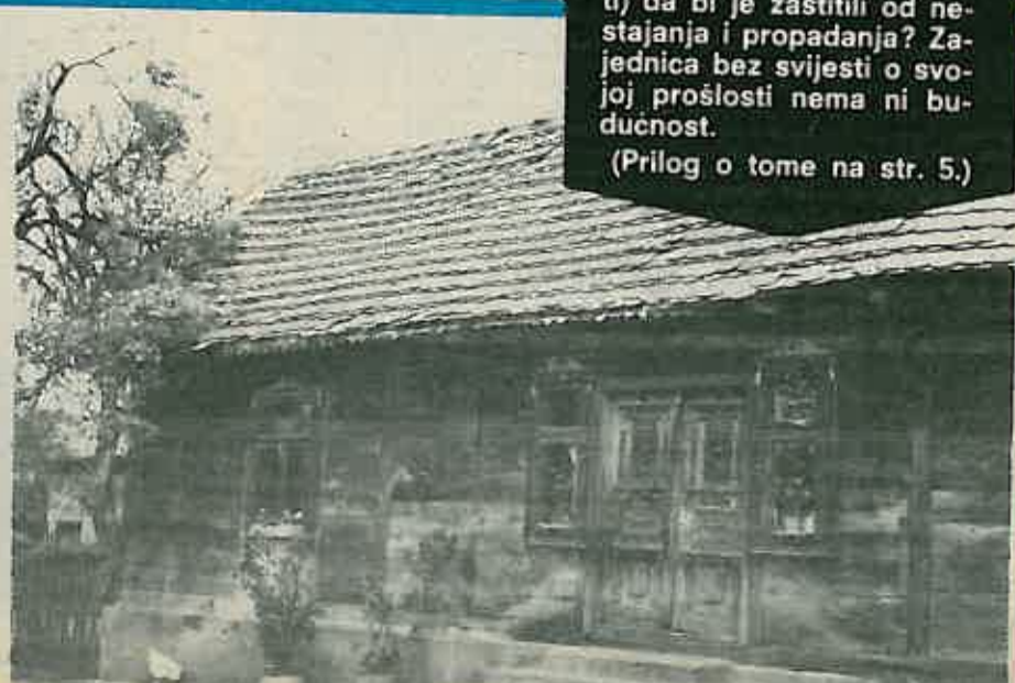
Ljepotice iz Obedišća