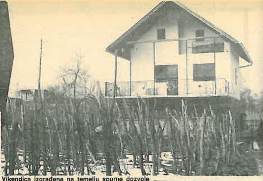
Vikendica izgrađena na temelju sporne dozvole

ka izdato je i rješenje o poništavanju izdate građevne dozvole, nakon čega naš građanin podnosi zahtjev za onime što mu je i obećano. Odgovor na to nikada ne dobiva. On se obratio i Komisiji za žalbe, koja mu odbija žalbu i traženje. Vrhovni sud Hrvatske također 1972. g. odbacuje tužbu. S obzirom da nije izvršeno obećanje u pogledu zamjene zemljišta, izgrađen je objekt prema postojećoj dokumentaciji, a na temelju građevinske dozvole priključena je voda i struja. Građevinska inspekcija 1982. g. upozorava da je objekt sagrađen u drugoj zoni, koja je predviđena za gradsko groblje te da je objekt predviđen za rušenje. Budući da su ove godine predviđena rušenja objekata u zaštitnom pojasu groblja vlasnik tog objekta se zabrinuo za njegovu sudbinu te ponovo tražio pravnu i društvenu zaštitu. Krajem prošle godine o tome je u dva na-