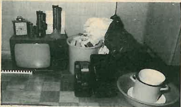
Dio ukradenih predmeta