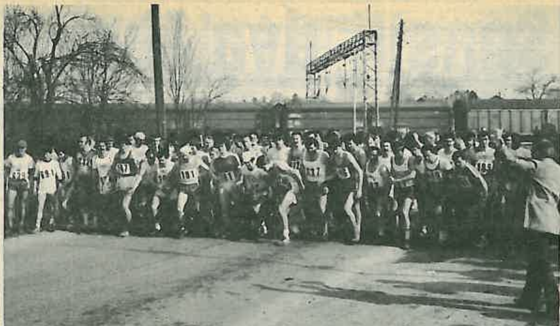
Start maratonaca 1981. g. – jedna od najboljih trka