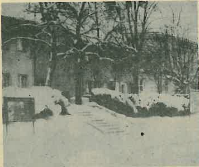
U očekivanju topljenja snijega

Umjesto da se sakrije ta naša nedomišljatost ona i dalje strši. Zamisljamo: uskoro će se održati tri sastanka (sa procijenjeno ukupno 30-tak sudionika), na njima će se upozoriti da to treba hitno maknuti, i da se sve to skupa ne smije ponoviti, i da su tu zakazali ti i ti. Za tu konstataciju, ako se zbroji vrijeme prisutnosti svih sudionika sastanaka, potrošiti će se ukupno oko sedam sati. Za makivanje tog »novogodišnjeg ukrasa« biti će potrebno pola sata.