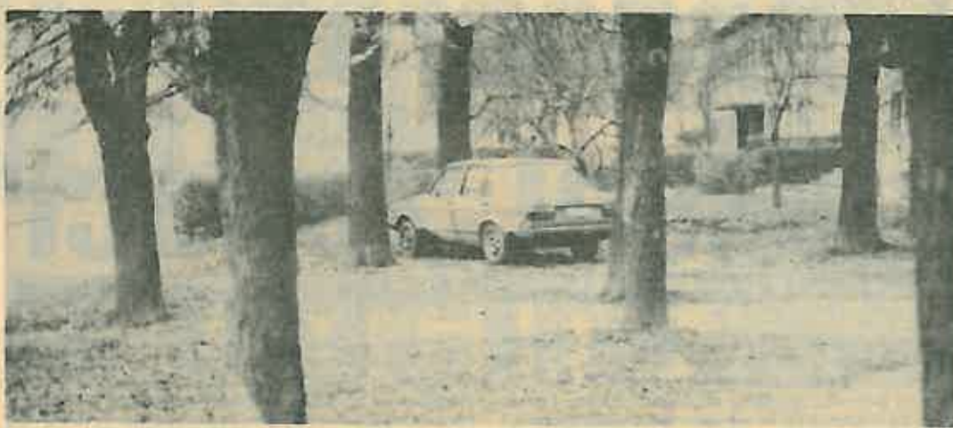
JAVNA POVRŠINA - POVRŠINA OPĆE NEBRIGE