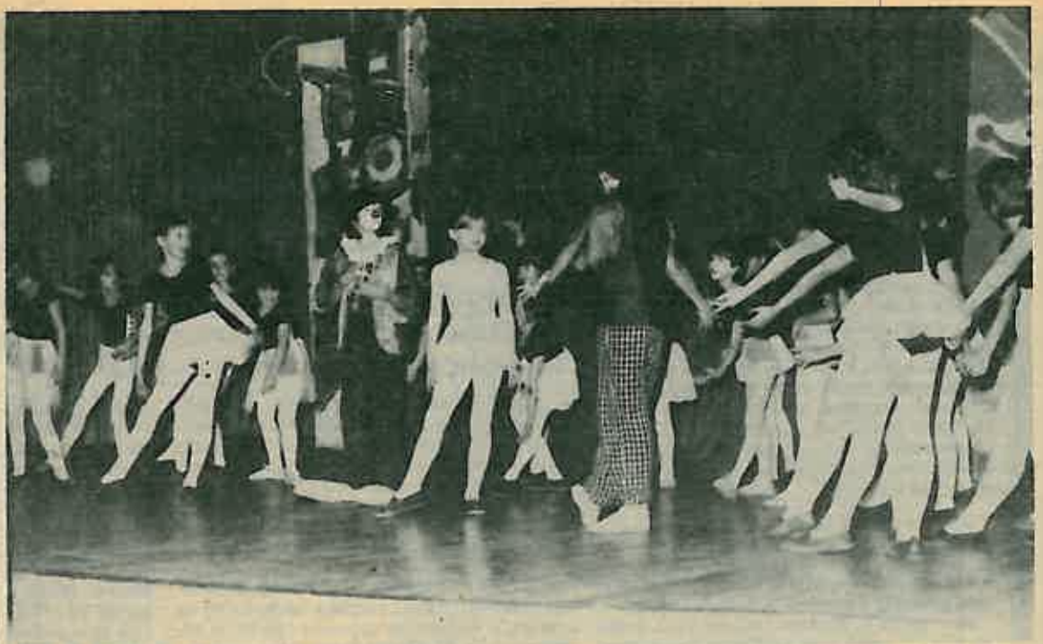
Razigrana djeca dobro zamišljene priredbe