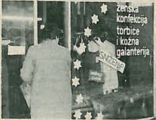
Lijepo, moderno i kvalitetno za plitke džepove – prodavaonica Budućnosti

U »dobra stara vremena kada nam je bolje išlo« rasprodaja je bila samo za »sirotinju« (barem je tako većina mislila) jer je ponuda robe bila daleko lošija no što je to danas.