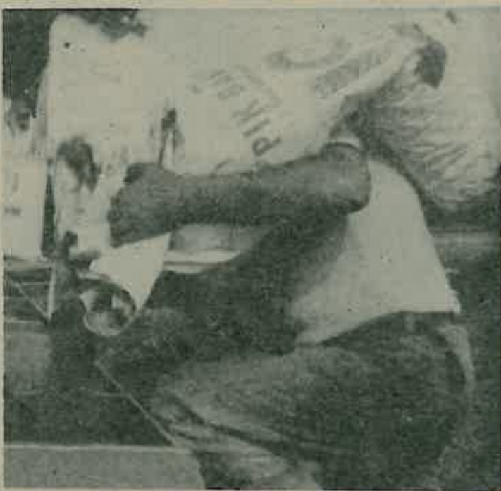
Sjemenskog kukuruza i krmne robe ima dovoljno pa se nalaze u prodaji. Problema ima i u snabdijevanju rezervnih dijelova i guma, ali se ipak pojedini dijelovi mogu kupiti.

Poljoprivredna zadruga je djelomično rješenje potražila u kooperaciji sa Zvijezdom, koja bi kooperantima osigurala umjetno gnojivo, pesticide i herbicide za proizvodnju pšenice i kukuruza uz uvjet da otkupi cjelokupnu ugovorenu proizvodnju tih žitarica. Dogovori su u toku, ali se PZ nada povoljnom ishod.