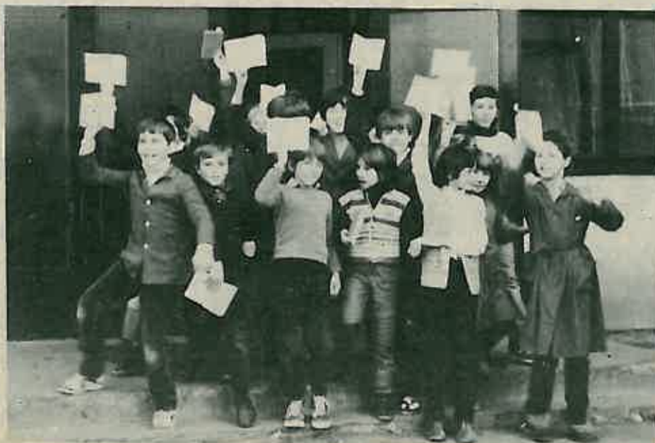
»Ja sam prošao s pet, ja s četiri...«