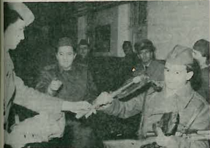
Zaduživanje opreme i naoružanja