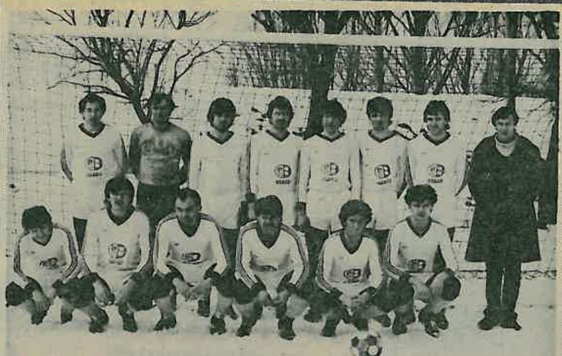
NK »Rugvica« — najbolji u 83