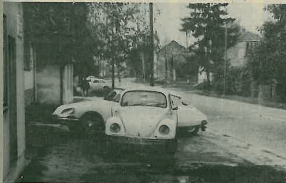
U nedostatku parkirališnog prostora automobili često zatvaraju prolaz pješacima na trotoarima