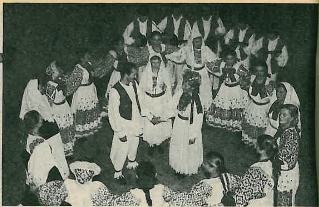
Amateri s profesionalnim obavezama

— Imate li u planu neke aktivnosti na polju međunarodne razmjene?