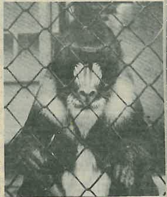
Rešetke kao ukras

Kod snimanja divljači, tehnika će velikim di-