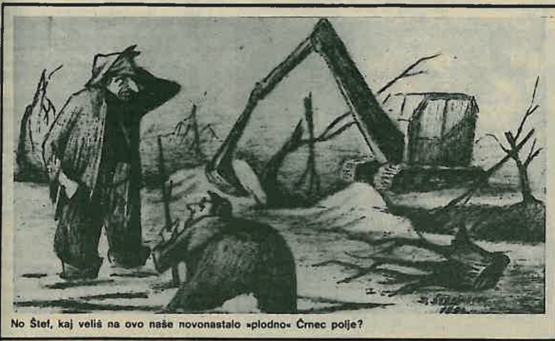
No Štef, kaj veliš na ovo naše novonastalo »plodno« Črnc polje?

Savjet za sigurnost prometa SO Dugo Selo, sastao se nakon dužeg vremena i konačno donio svoj program rada. U programu su obuhvaćeni bitni elementi koji utječu na sigurnost prometa uopće, s tim što je naglasak stavljen na rješavanje pitanja parkirališnog prostora.