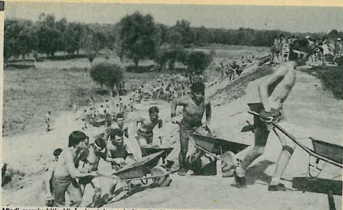
Mladi moraju biti uključeni u tokove društvenih zbivanja

Informirano je o bitnim pitanjima i problemima OOUR-a — 52% upitanih ne zna da li je u njihovom OOUR-u raspravljano o reformi odgoja i obrazovanja, dok je 30% sigurno da o tom problemu u njihovim kolektivima nije raspravljano