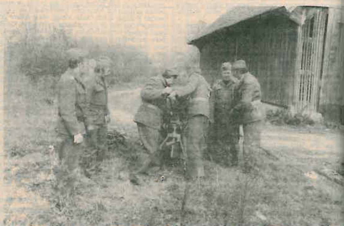
Uspješna priprema u selu Jezevo omogućila odlično gađanje na Slunju