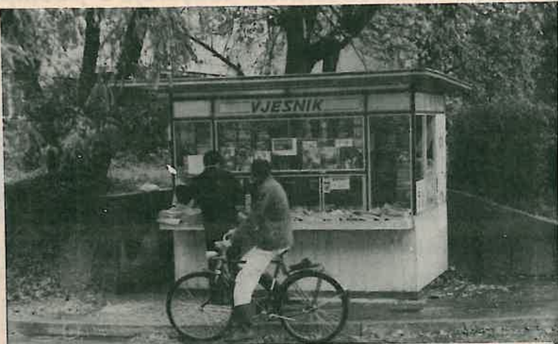
Kako do bolje i objektivnije informacije

Odbor vodi brigu o uspješnom provođenju cjelokupnog procesa informiranja, kako onom koji se ostvaruje putem javnog glasila (ukoliko OUR izdaje svoj list), putem biltena, tako i o svim drugim oblicima neposrednog obavještanja radnika (na zborovima i sjednicama organa upravljanja i DPO). Uvođenje takvog samostalnog tijela, koje za razliku od prijašnjih savjeta ili odbora kao pomoćnih tijela organa upravljanja dobija šire, konkretnije kompetencije i veću