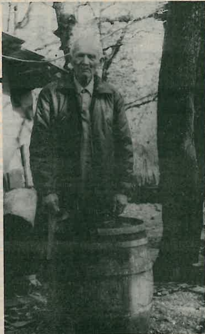
Starost ispunjena radom i zadovoljstvom