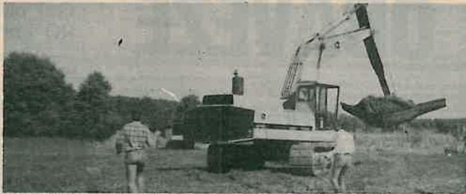
Radnici OVP Zagreb OOUR »Vodoprivreda« Dugo Selo na jednom od radišta u Lupoglavu

Projekt putne i kanalske mreže bio je na javnoj raspravi i prihvaćen je nakon velikog zauzimanja učesnika komasacije, projekatana, nadzornog organa i rukovodstva DPO u Mjesnoj zajednici Lupoglav. Izvršene su izmjene od interesa za učesnike komasacije i za lakše izvođenje