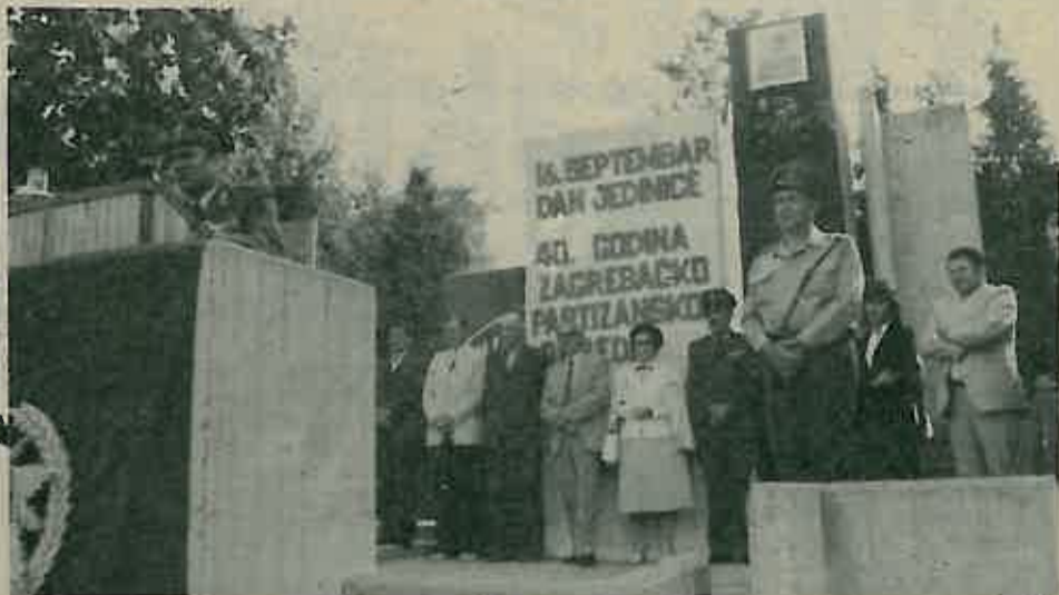
Sa proslave Dana jedinice u Dugom Selu

16. rujna u kasarni »Zagrebačkog partizanskog odreda« Dugo Selo svečano je obilježen Dan jedinice, datum kada je prije 41 godine formirana V Kordunaška NOU brigada, čije ratne tradicije danas nastavljaju pripadnici jedinice u Dugom Selu.