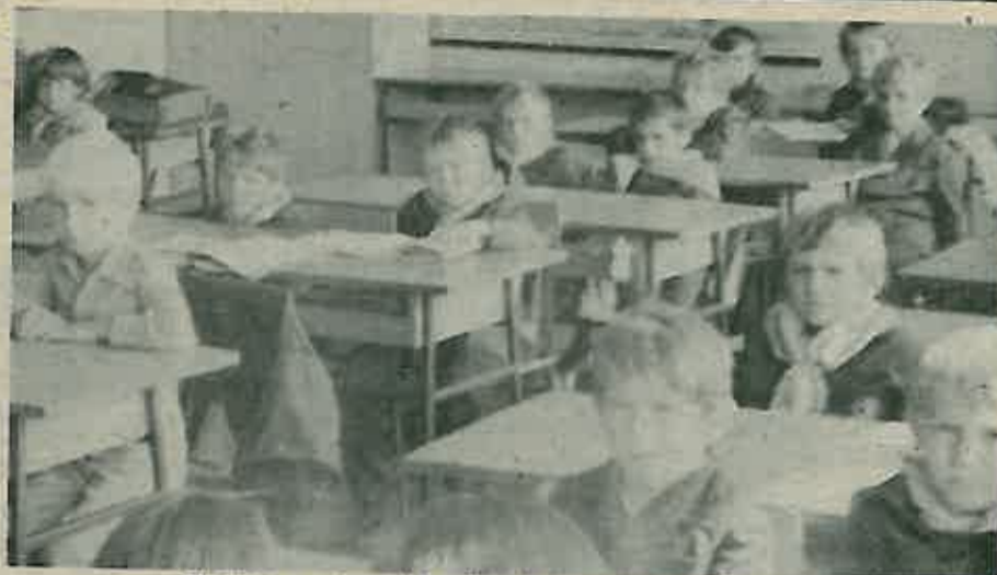
Problem prostora još uvijek je jedan od najaktualnijih

Stanovnici dugoselske općine bore se već dugo sa problemom pitke vode, točnije rečeno, nje u našim