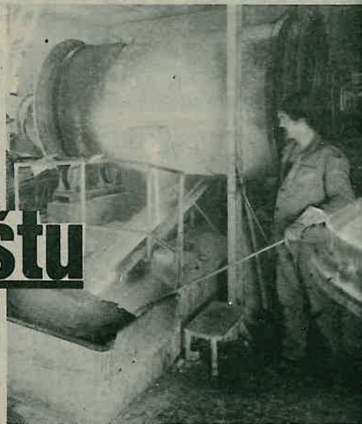
Proizvodnja emajla i glazura odvija se djelomičnim kapacitetom.

OOUR Kemijska proizvodnja ostvario je ukupan izvoz na konvertibilnom tržištu u iznosu 28,8 milijuna dinara, što je u odnosu na isto razdoblje 1982. godine manje za 47%. Pored toga na klirinškom tržištu ostvaren je iznos u visini 172 milijuna dinara. OOUR Kemijska proizvodnja plasirao je svoje proizvode na tržišta DR Njemačke, Poljske, Italije i manjim dijelom na bugarsko tržište.