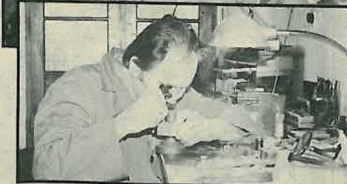
Polako, da ruka ne zadrhti...