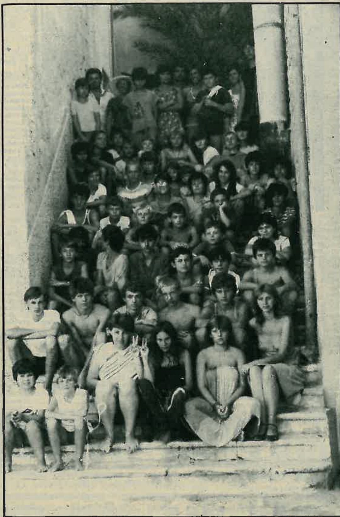
Jedna od smjena