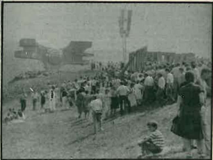
Proslavi je prisustvovao veliki broj ljudi