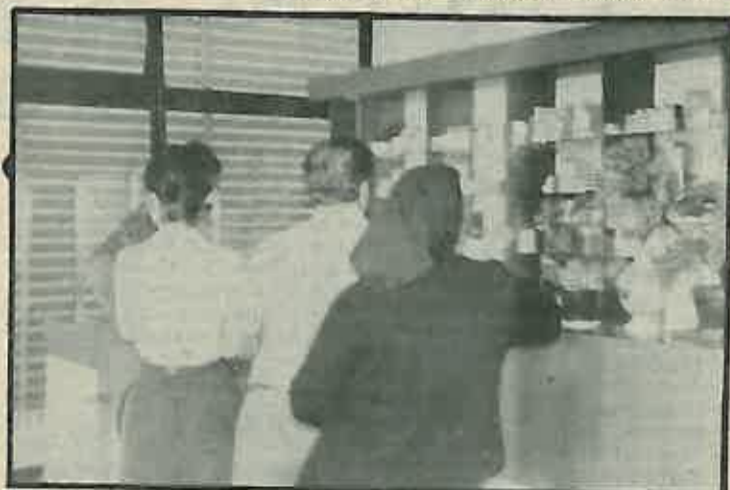
Čekajući na lijek

Da bi se izbjeglo to nepovjerenje, to slanje bolesnika doktoru da napiše novi recept razvila se suradnja između Doma zdravlja i ljekarne koja je na visokom nivou. Tako su u Domu zdravlja redovito obaviješteni kojih lijekova ima tako da je liječnik u