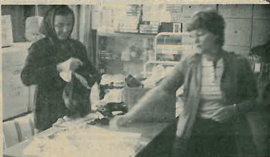
DOBRA USLUGA – ZADOVOLJAN KUPAC

RO «Budućnost» raspodjelu dohotka, čistog dohotka i sredstava za osobne dohotke regulira SAS-om kojeg su uz sudjelovanje sindikata i nakon opširne rasprave radni ljudi osobnim izjašnjenjem prihvatili na referendumu. U svom sastavu RO ima OOUR «Trgovina», OOUR «Ugostiteljstvo» i Radnu za-