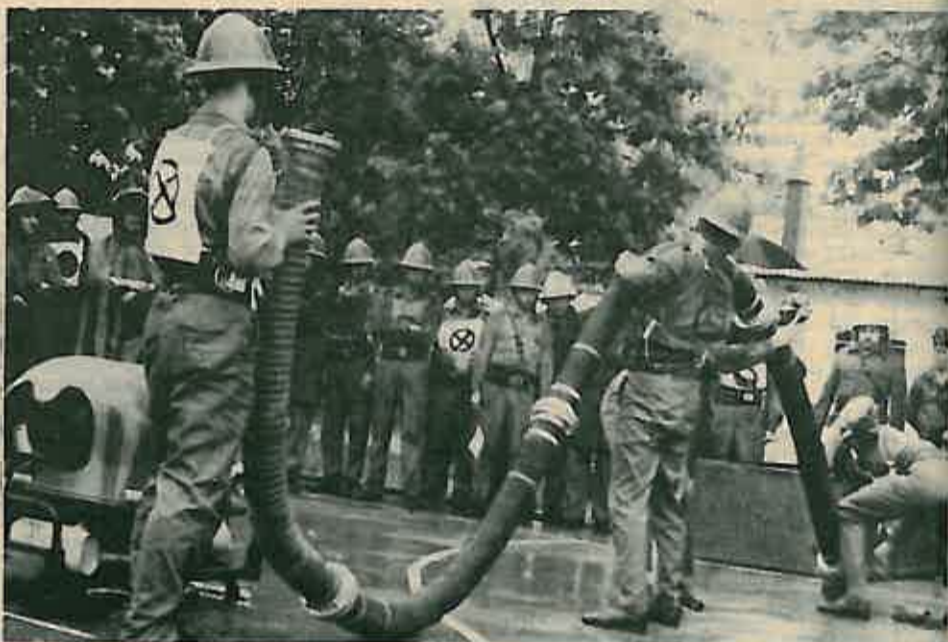
Pobjednička ekipa garnizona Dugo Selo