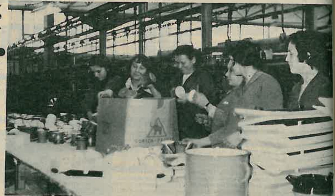
»GORIČINI« ARTIKLI SVE TRAZENI NA INOSTRANOM TRŽIŠTU

Jedan i drugi OOUR je u prethodnom razdoblju ostvario rezultate koji su bili ispod planiranih ve-