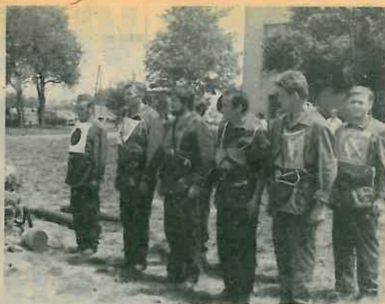
VJEŽBOM DO VISOKE OSPOSOBLJENOSTI

Sve ovo ukazuje na izuzetnu važnost i pripremu kapaciteta za održavanje i popravak sredstava potrebnih OS i stanovništvu u ratu. Budući da su ti kapaciteti u domeni male privrede, potrebno je što više stimulirati njen razvitak na području naše općine.