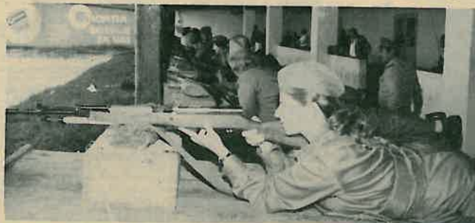
GADANJE - SASTAVNI DIO OBUKE

Ovogodišnja nastava zapravo je bila obnavljanje stečenog znanja i iskustva od prethodnih godina, te nastavak osposobljavanja za potrebe neposrednog osiguranja tvornice u slučaju rata. S obzirom na kratkoću trajanja nastave u odnosu na prethodne godine, polaznice obuke bile su zauzete radom gotovo cijeli dan, što je bilo potrebno da bi se program izvršio. Povodeći se iskustvima prethodnih godina kad je bilo prisutno nekoliko organizacijskih problema, što je prihvaćeno kao neizbježno s obzirom da je to tek početak, poduzete su odgovarajuće akcije u cilju njihovog otklanjanja, te u cilju što boljeg osposobljavanja žena, koji proizlazi iz značajne uloge koju takve jedinice imaju u jedinstvenom sistemu ONO.