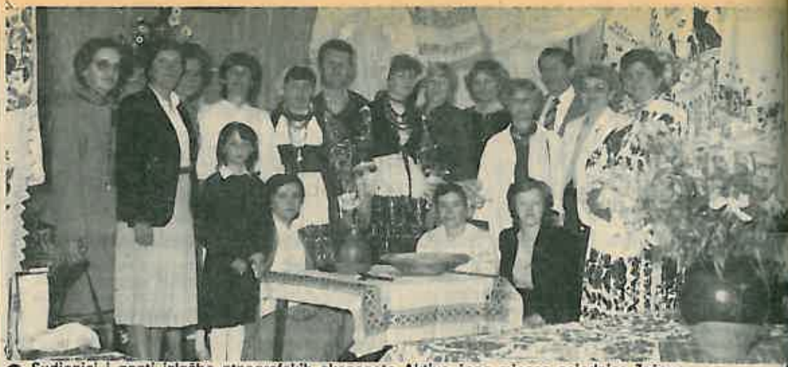
Sudionici i gosti izložbe etnografskih eksponata Aktiva žena mjesne zajednice Ježevo

Ritmičke grupe rade na bazi samofinansiranja – troškovi se podmiruju iz uplata roditelja bez kojih se rad ne može normalno odvijati. Cijene su zaista minimalne i u pola manje nego u Zagrebu, što pokriva i štednjom i organizacijom, pa molimo one roditelje, koji do danas nisu podmirili svoje obaveze, da to učine što prije, kako bi i financijski zaokružili ovu uspješnu godinu rada naših ritmičkih grupa. (T. G.)