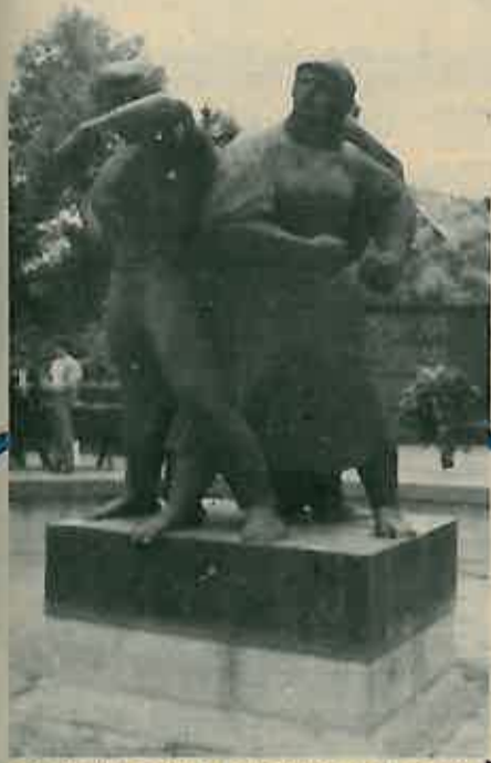
SPOMENIK PALIM BORCIMA U OBOROVU

Porobljavanje Jugoslavije i njezina podjela ogorčili su jugoslavenske narode, ali istovremeno podigli i njihov borbenu duhu. Većina je bila svjesna da je potrebno povesti borbu za oslobođenje od okupatora i njegovih plaćenika. Ovaj povijesni zadatak mogla je ispuniti jedino Komunistička partija Jugoslavije, jer je imala povjerenje naroda cijele Jugoslavije, koje je stečeno ispravnom politikom u ranijim borbama protiv eksploatacije, nacionalnog potlačivanja i nenarodnih režima.