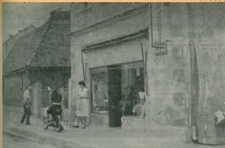
PRODAVAONICA DJEČJE KONFEKCIJE «BUDUĆNOST»