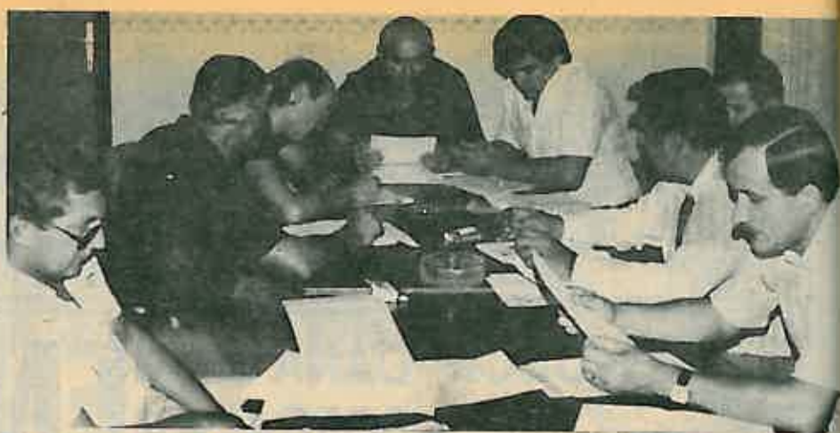
SA SJEDNICE KOMITETA SKH DUGO SELO

Poštivati jedinstvene otkupne cijene žitarica na cijelom tržištu u zemlji