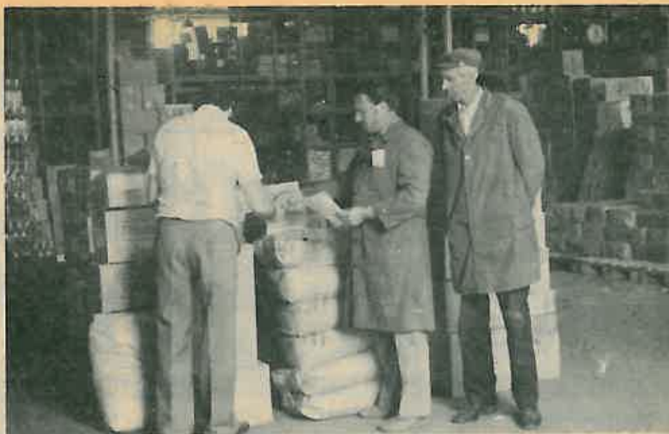
SKLADIŠNI PROSTOR – GARANCIJA SNABDJEVENOSTI