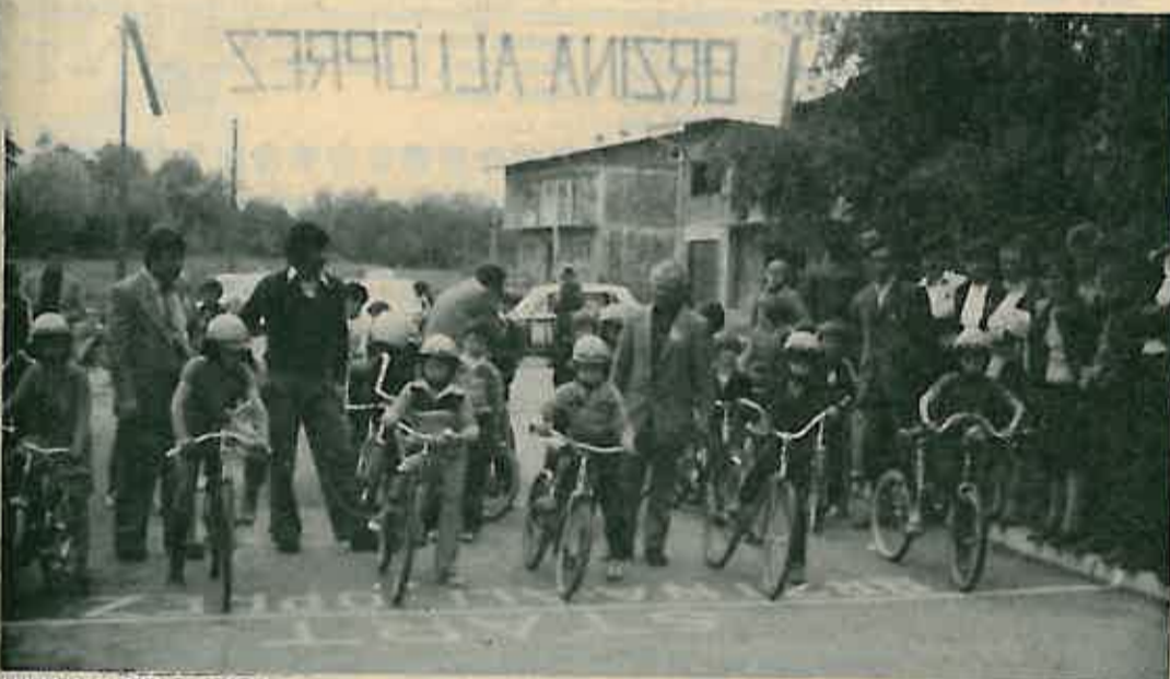
PRIPREMA, POZOR, START!