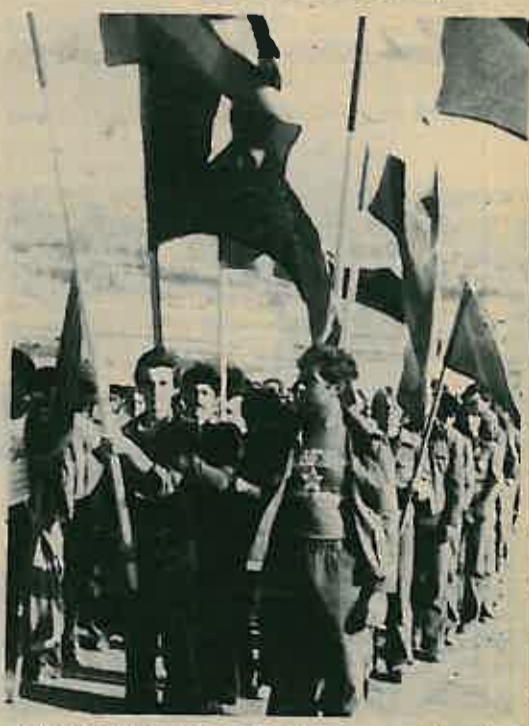
ORB »VRANEK MATO-ČAPAJEV«