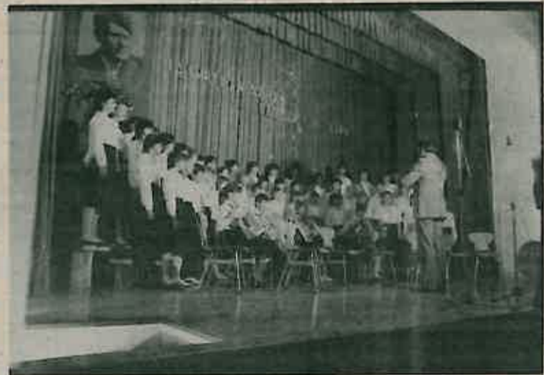
Pjevački zbor Osnovne škole Dugo Selo na Općem saboru