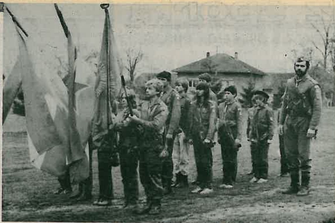
Izviđački odred poslije marša u Oborovu 29. III 83.

ma, mjestu gdje je osnovana II moslavačka brigada. Dio puta po asfaltu vodio nas je naš vođa posade, koji je dobro poznao taj kraj, ali došavši podno Moslavačke gore morali smo ići po azimutu i osloniti se na načelnikovo poznavanje topografije. Put je bio loš, kolske staze se skoro nisu ni poznavale, voda potoka se izlila iz svojih korita, a snijeg kao za inat pada tako gusto kao da nam prkosi i ne pušta nas dalje, ali kolona ide. Sve je mokro, odjeća i obuća na nama, oprema u rancu, šatorska krila koja nas koliko-toliko štite od snijega, a ranac sve teži i teži. Noge promrzle, mokre ruke ne osjećamo, a snijeg i dalje pada. Odjednom povik: «Dvojica su pala u potok» - trk, pomoć drugovima, smijeh ali i suze u tim malim, ali odlučnim očima. I pored toga kolona kreće dalje. Polako, ali sigurno, korak po korak. Kreću se tijela djece po sniježnim bespućima. Teško nam je, ali zar je to moguće, na čelu kolone čuje se pjesma koju onako spontano prihvaćamo svi. Nema izviđača koji više mari za snijeg, mokre cipele i promr-