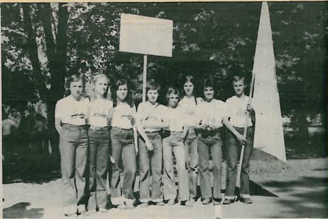
ČLANOVI EKIPE PODMLATKA CRVENOG KRIŽA, KOJI SU OPĆINU DUGO SELO PREDSTAVLJALI NA NATJECANJU ZO ZAGREB 1977. GODINE U KRAPINI

Predsjednik Komisije za unapređenje prve pomoći OOCK Dugo Selo, ujedno i predsjednik ocjenjivačke komisije na natjecanjima Todo-