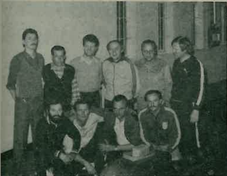
Ekipa OVP-a na RSI u kuglanju

Važno je istaknuti da je pokrenuta najodlučnija akcija za konačan završetak sportskog centra prije svega završetak neophodnog nogometnog igrališta. O rezultatima akcije u idućem broju. B. G.