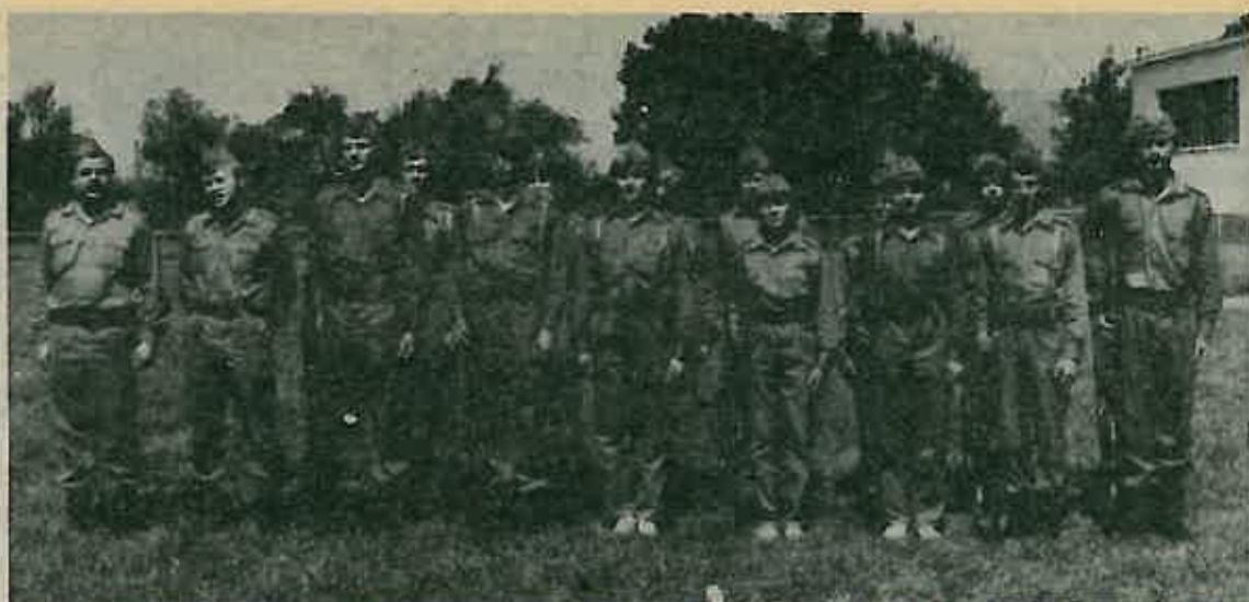
Sa prošlogodišnje obuke srednjoškolske omladine