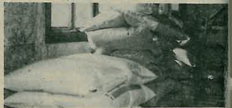
Neki poljoprivrednici već su ranije nabavili gnojivo

U izgradnji ovih novih postrojenja sudjelovale su na temelju Samoupravnih sporazuma i mnoge radne organizacije, među kojima je i naša Poljoprivredna zadruga »Gornja Posavina«, koja je upravo ovih dana uplatila još jedan dio novca za izgradnju novog postrojenja. Na temelju ovakvih financijskih ulaganja, svim sudionicima će prema samoupravnom sporazu-