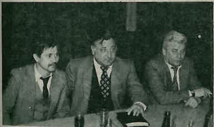
5. godišnje skupštine NK «Rugvica» - Opcinski trenerski kadar.

Nogometaši su u toku 1982. godine odigrali 26 utakmica od kojih su 14 riješili u svoju korist, 3 igrali neriješeno i 9 puta priznali nadmoćnost protivnika. Pri tome su postigli 46, a primili 48 golova. Najviše puta je protivničku mrežu zatresao Jozo Bekavac 8 golova, dok su najveći broj utakmica odigrali Đivan, Štambuk i Pave Sukan.