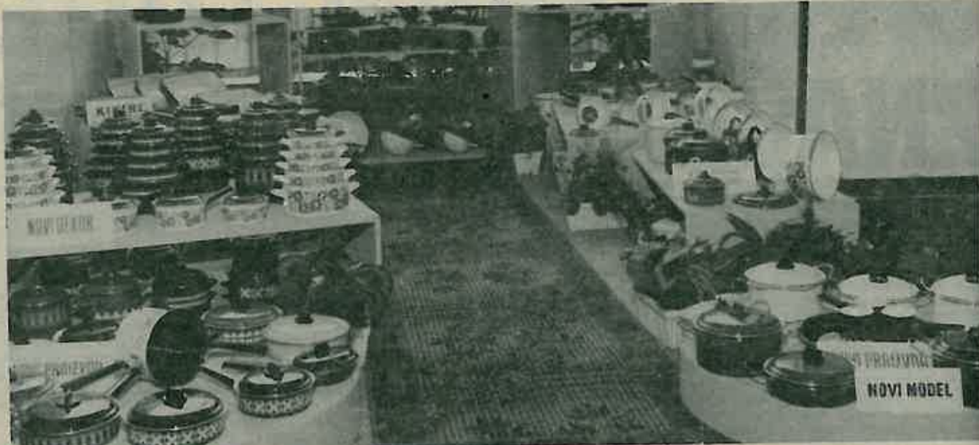
ASORTIMAN »GORIČINI« PROIZVODA

Plan poslovanja radne organizacije »Gorica« za 1983. godinu donesen je u vrlo složenim uvjetima poslovanja, kao što je neizvjesna situacija u pogledu snabdijevanja sa sirovinama i repromaterijalom, u pogledu vanjskotrgovinskih odnosa. Pored toga kasnilo je donošenje saveznih i republičkih dokumenata - Rezolucije i Zakona o deviznom poslovanju. Neki dokumenti, važni za poslovanje, a koji bi trebali biti osnovno polazište za planiranje proizvodnih i finansijskih rezultata, naročito oni koji se odnose na područje izvoza i vanjskotrgovinskih odnosa, još i sada nisu poznati. U takvim okolnostima bilo je moguće realno planirati samo okvirne orijentacije u radu tokom 1983. godine. Ovisno o neposrednim okolnostima što će ih nametnuti zakonski propisi i situacije u pogledu opskrbe sa sirovinama, planirane