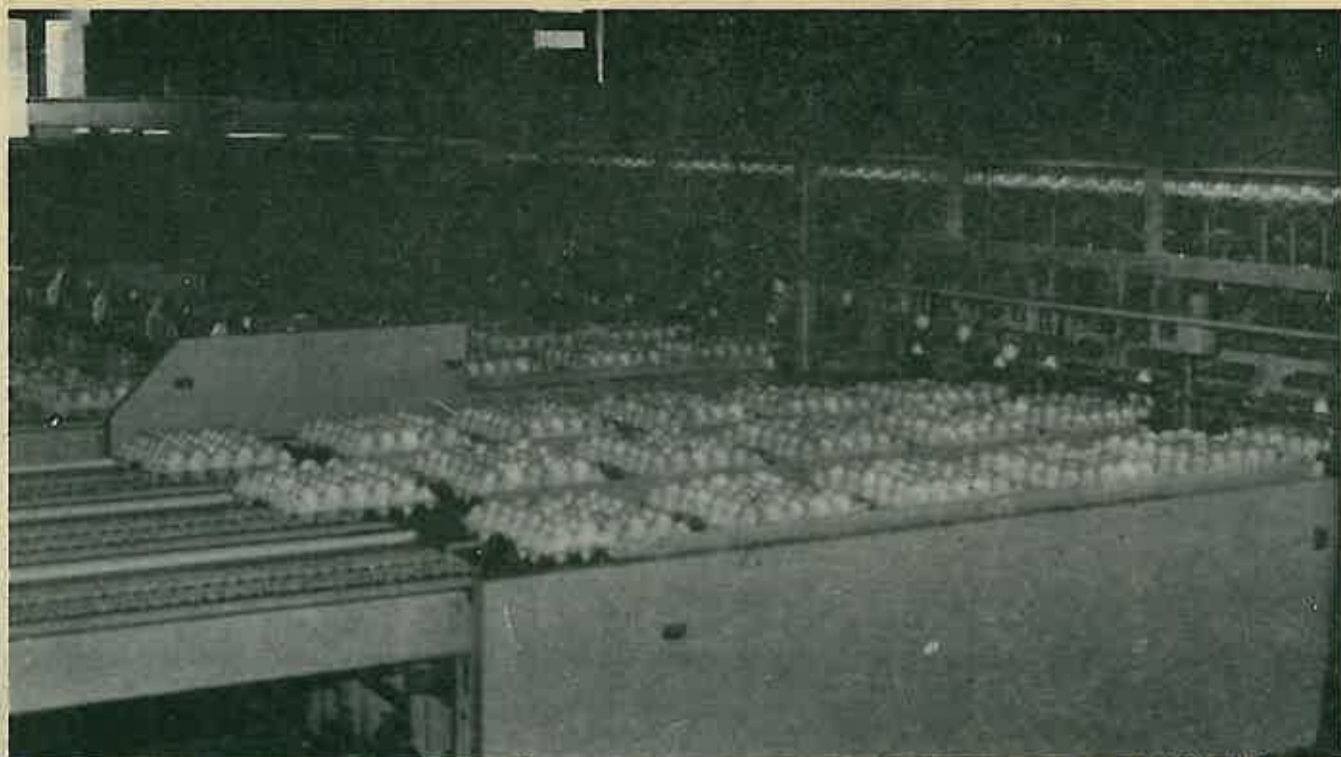
Novi stroj za sortiranje jaja u Božjakovini