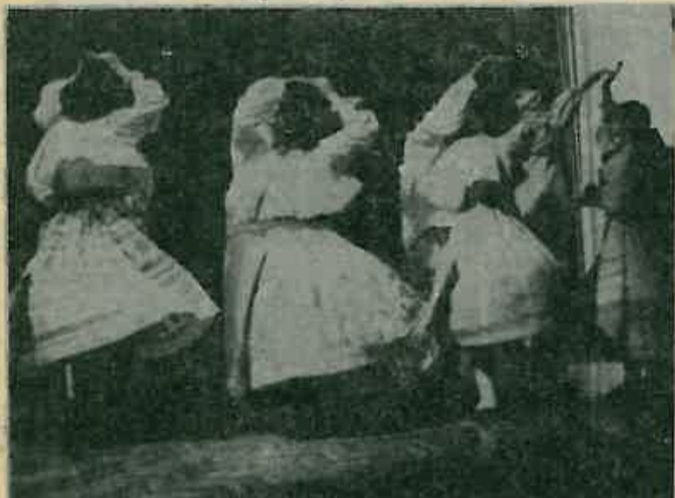
Nastup KUD-a »Smerda«