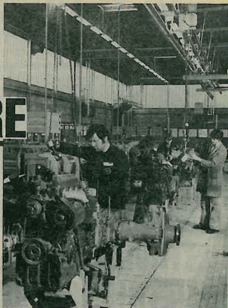
Početna faza montaže traktora u proizvodnom procesu

Gosti su postavili niz praktičnih pitanja za drugove iz