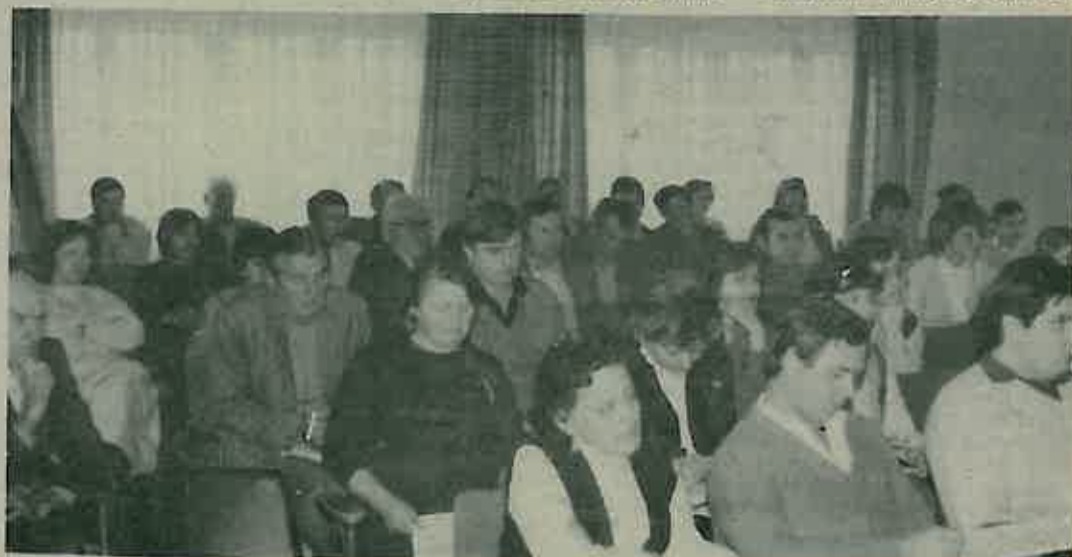
Odbornici S. O. Dugo Selo na sjednici 28. siječnja 1982.