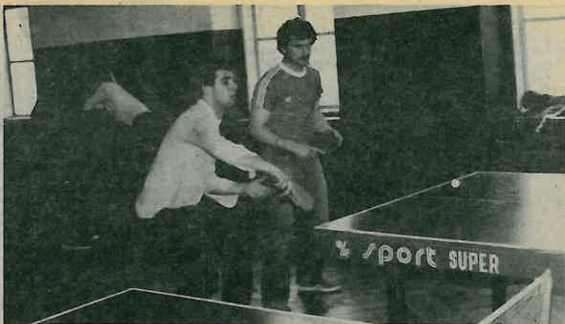
Ekipa OO SSO Čmeć, trećeplasirana na općinskom prvenstvu u stolnom tenisu.