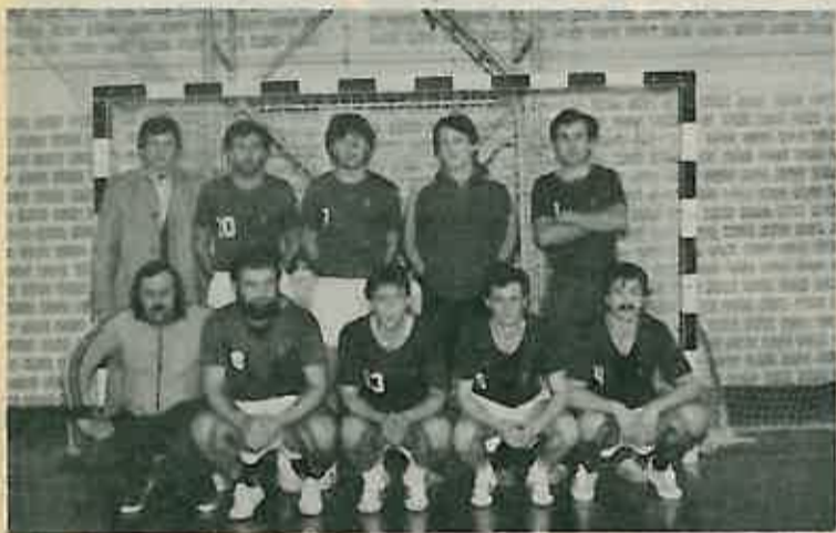
Pobjednička ekipa – zapravo NK Jedinstvo

4. PODMLADAK CRVENOG KRIŽA OSNOVNE ŠKOLE -POSAVSKI PARTIZANSKI ODRED - U RUGVICI