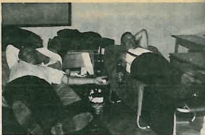
Dobrovoljni davaoci krvi iz Rugvice