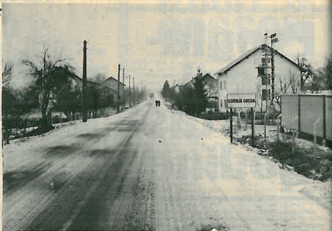
Zimska perspektiva MZ Gornja (Lupoglavka) Greda

Vozeći se asfaltiranom prometnicom iz Dugog Sela prema autocesti Ivanja Reka - Lipovljani s kolazom u Ivanic Gradu i prošavši kroz Brckovljanu stižemo u mjesnu zajednicu Gornja Greda, mjesto naseljeno uz obje strane ceste. Naselje je smješteno u ravničarskom dijelu, a okružuju ga polja, koja su obično zasijana kukuruzom.