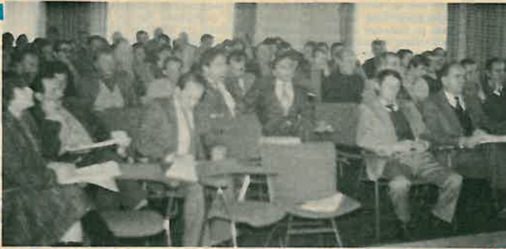
Na sjednici Skupštine općine