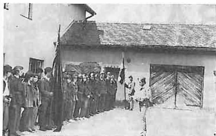
Prije nego što je odred krenuo na zadatak, pročitana je zapovijest

problema a se po- liječenih naše ko- 6. 1970. o svake olja pro- stiniraju U klubu radnik. Klub je i postig- re samo jednicu. lit ćemo gubi go- og alko- i liječe- s rada, alkoho- osti ra- materi- u samo polizma. ocijalni ži i ne