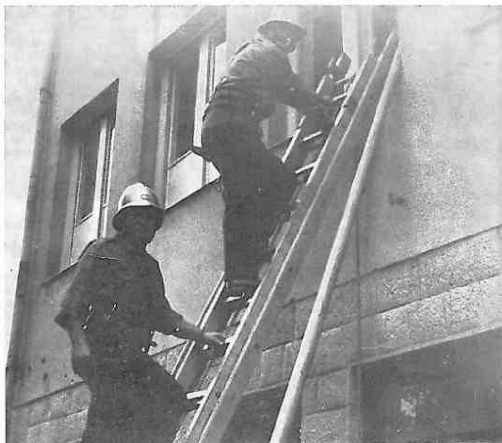
Izvođenje vježbe na spasavanju imovine