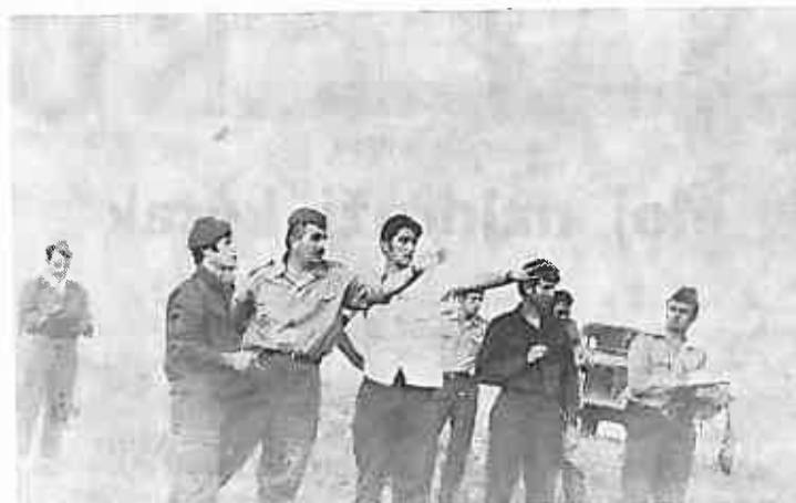
Na komandirskom izviđanju