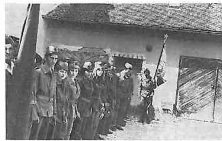
Sve je spremno, čeka se znak: POKRET