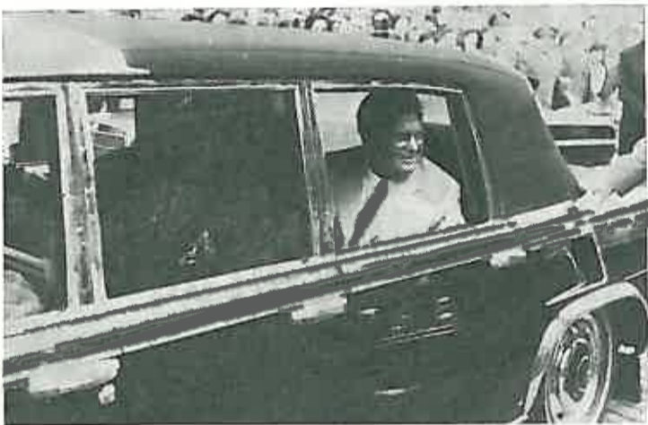
Predsjednik Tito u automobilu, okružen razdraganim Dugoselčanima

DUGO SELO — U svečanom ruhu i raspoloženju dočekalo je Dugo Selo, u petak 10. rujna ujutro oko 8,30 sati, svog najdražeg gosta druga Tita, njegovu suprugu Jovanku i pratnju u kojoj su se nalazili najviši državni i politički rukovoditelji SR Hrvatske: Dragutin Haramija, dr. Savka Dabčević-Kučar, Josip Đerđa, Ivan Šibl, Pero Pirker, Milko Tri-