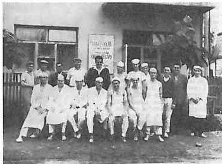
Kolektiv »Elektromlin« Dugo Selo

Pošto je bilo dovoljno problema sa aspekta alkoholizma javila se potreba za osnivanjem Kluba liječenih alkoholičara i na području naše komune. Klub je osnovan 12. 6. 1970. Članovi se sastaju redovito svake srijede u 19 sati. Klub okuplja prosječno 15 članova, koji apstiniraju prosječno oko godinu dana. U klubu rade 2 liječnika i socijalni radnik. Za godinu i pol postojanja Klub je postigao vidne rezultate. Ovi postignuti uspjesi mnogo znače ne samo za nas već za čitavu našu zajednicu. Da je to zaista mnogo shvatiti ćemo ako proračunamo koliko se gubi godišnje zbog jednog kroničnog alkoholičara. Kao prvo to ulazi liječenje, gubitak uslijed izostanka u radu, naknade u toku bolovanja alkoholičara, smanjenju produktivnosti rada, itd. Sve to su ogromni materijalni gubici. Ali ovi gubici su samo dio posljedica utjecaja alkoholizma. Na žalost, a to je tako, socijalni problemi su daleko veći, teži i ne (Nastavak na str. 4)