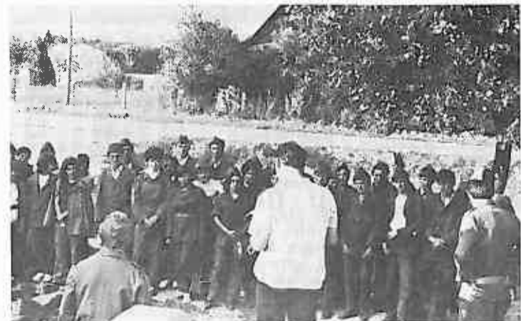
Društveno-politički radnici Moslavačke Gračanice pozdravljaju dolazak našeg odreda u njihovo mjesto