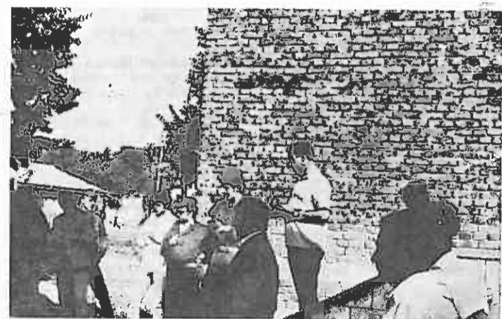
Društveno-politički radnici Moslavačke Gračanice i rukovodstvo odreda u razgovoru