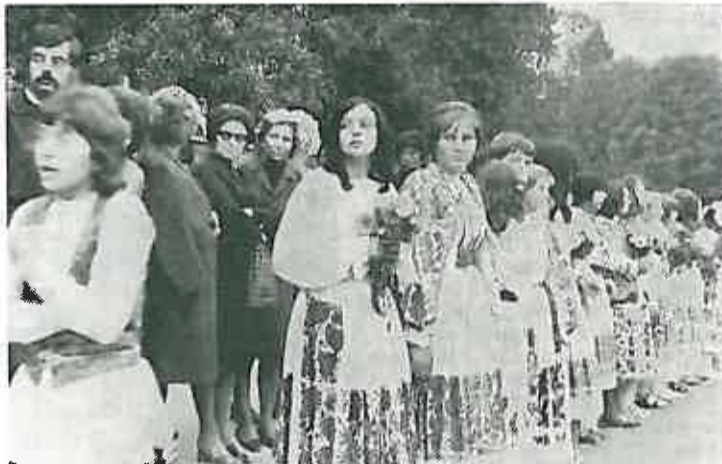
Tita su dočekale i djevojke u narodnim nošnjama