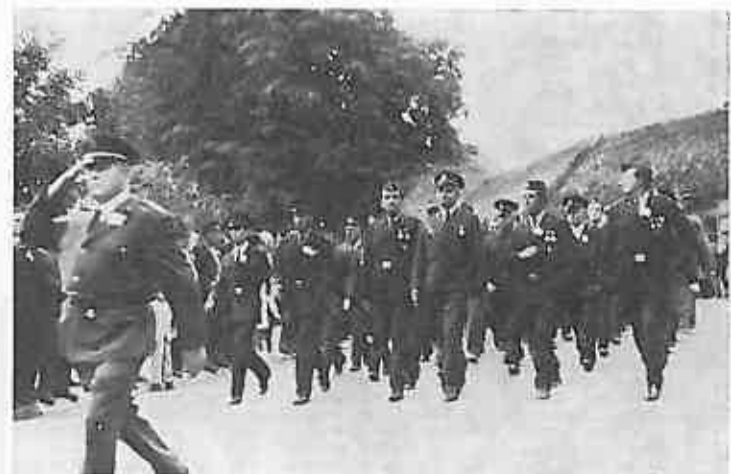
ZELINA — svečani mimohod vatrogasaca

No ipak moramo priznati da smo zadovoljni jer je od naše strane prisustvovalo oko 110 operativnih vatrogasaca, te predstavnici Skupštine općine i društveno-političkih organizacija.