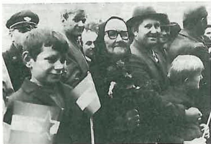
Cvijeće za voljenog druga Tita — i ova baka došla je da dočeka Predsjednika i suprugu Jovanku i da ih daruje poljskim cvijećem