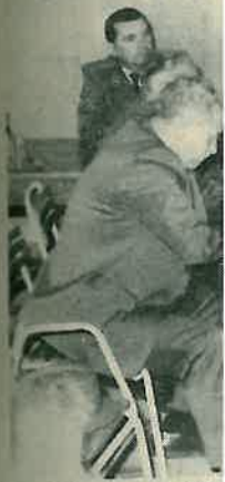
Sa izborne godišnjice

Radnički savjet OOUR-a Šijunice, RO »Kograp« donio je odluku o besplatnom davanju batude za pavanje puteva, zajedno s utovarenim svim mjesnim zajednicama, koje su dužne same organizirati prijevoz materijala. Pozivaju se mjesne zajednice da iskoriste tu povoljnost.