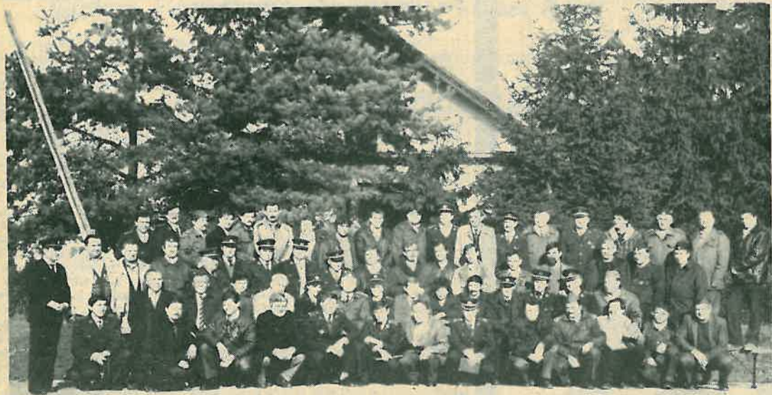
Vatrogasci iz raznih krajeva na zajedničkom zadatku

Ali je Josip Harambaša bio i slikar i grafičar koji je svojim likovnim djelima ukrasio više dugoselskih i posavskih domova, te Muzej revolucije u Oborovu. Od prvog dana kako je, kao samouk, poslije rata uzeo kist i olovku u ruku, motivi njegovog slikarskog umijeća uglavnom su prizori iz partizanskog ratovanja i života, te krajoblici njegovog rodnog dugoselskog kraja. Ilustrirao je više knjiga mnogim crtežima iz borbe: seljanka hrani partizane, borci ruše željezničku prugu, postrojavaju se na smotri, jurišaju u Oborovskoj bitki, prebacuju hranu skelom preko Save za postradale u ustaničkim krajevima i drugo. Naročito je uspješno i nadahnuo uljepšao Vuričeve pjesme, oživljujuć njegovu kuću u Kozinščaku i njegove pjesničke motive upečatljivim crtežima iz prirode i seljačkog života. Značajan domet postigao je i u nekim slikama u ulju, kao u slici »Partizanska kolona«, a posebno u pejzažima naših posavskih ravnicama te panoramama iz predratnog Dugog Sela i s Martin-brega. Mnogi njegovi radovi, uslijed intenzivne društvene aktivnosti, a zatim i bolesti, ostali su nedovršeni, a pogotovu je gubitak za naš kraj i revolucionarni pokret što nije dospio dovršiti veliko platno u ulju o Oborovskoj bitki. Njegov slikarski stil odlikuje se minucioznošću i realističkim pravicama. Iako nevelik, njegov likovni opus ostat će živ u mirnoći vječnog snivanja, jer umjetnička djela ne umiru i traju u vjekove, pričajući budućim pokoljenjima o jednom vremenu i životu.