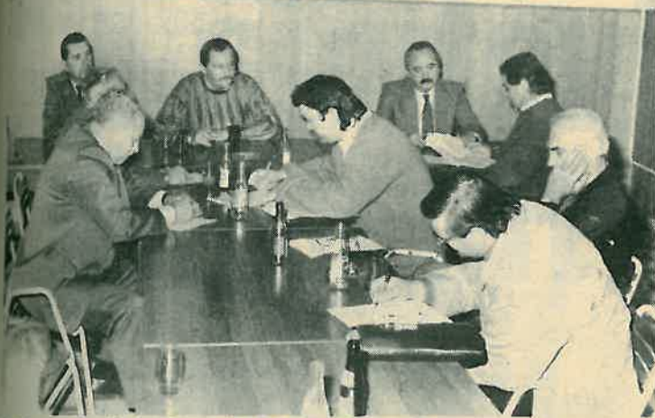
Na izborne godišnje Skupštine »Partizana«

OPĆINSKI SAVEZ ZA SPORTSKU REKREACIJU »PARTIZAN«