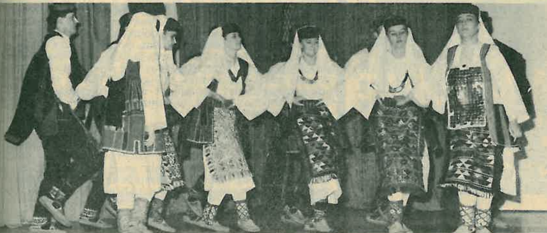
Folklorni nastup »Preporoda« na akademiji povodom Dana Republike