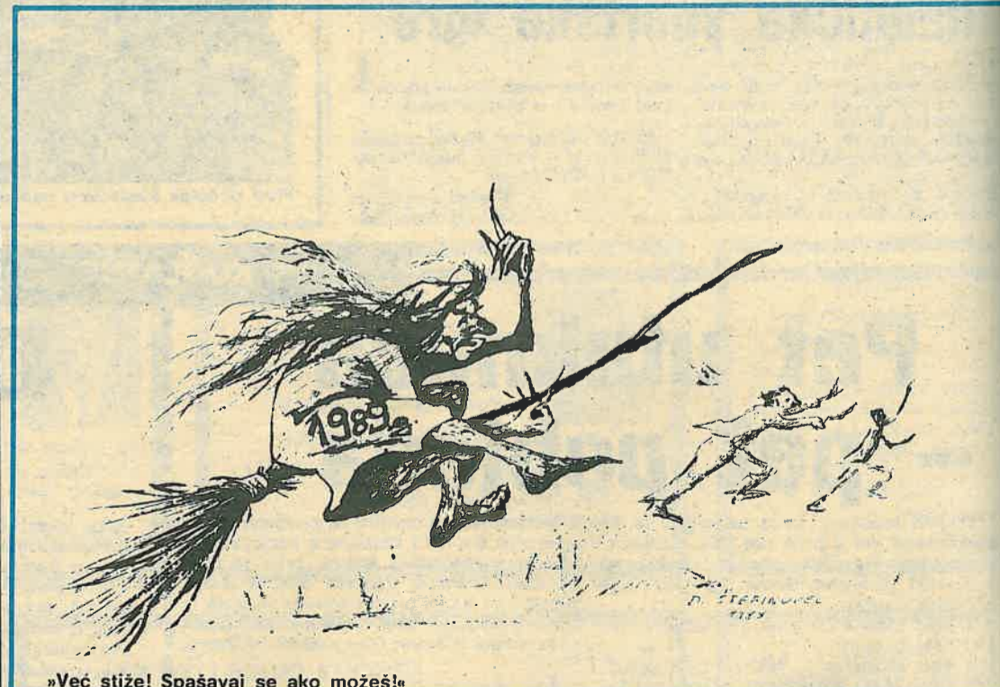
»Već stiže! Spašavaj se ako možeš!«