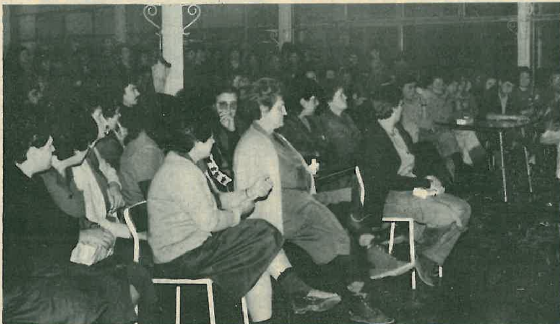
Izvanredni zbor radnika OOUR-a Proizvodnja posuđa

U popodnevnom satima radnici II smjene ponovno su tražili razgovor sa rukovodećom ekipom Radne organizacije, uz prisustvo Predsjednika Izvršnog vijeća Skupštine općine Dugo Selo i Sekretara Općinskog komiteta Saveza Komunističke organizacije Dugo Selo.