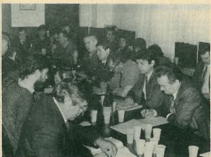
Sa sjednica Akcione konferencije SK »Kograpa«

Na temelju rasprave nisu formulirani nikakvi posebni zaključci, već je Predsjedništvo Akcione konferencije zaduženo da elemente iz rasprave upiše u program svoga rada.