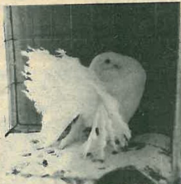
Jedan od golubova kakve ne možemo vidjeti baš svaki dan

Svi oni imaju svoje rodovnike, te-tovirani su i za njih društvo vodi matične knjige. Sve druge naše životinje su prstenovane saveznim prstenovima, što znači da su registrirane. Članom društva može postati svatko koji već ima registrirane životinje, kao i onaj koji ih nema ali je ozbiljno odlučio da ih nabavi i da se s njima bavi, s time da se pretihodno o tome mora izjasniti naš zbor. Svi smo mi veliki ljubitelji tih životinja. Posvećujemo im uistinu puno svog vremena, a i novca. Prisutan je među nama i jedan pozitivan natjecateljski duh: tko će uzgajiti i imati najbolje i najoriginalnije i najljepše primjerke. Inače smo i u stalnoj vezi sa izgajivačima iz drugih društava. O samoj izložbi nam je Pondeljak rekao slijedeće: »Ova naša izložba je jedanaesta