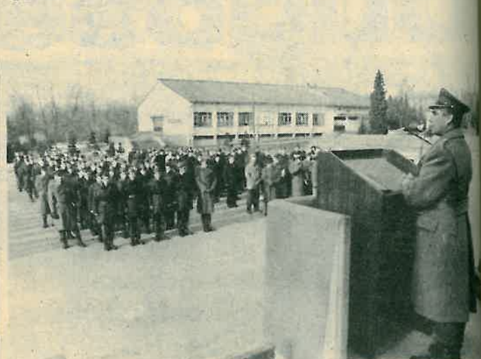
Svečanost u kasarni »Zagrebačkog partizanskog odreda«

Iz kasarne »Zagrebačkog partizanskog odreda«