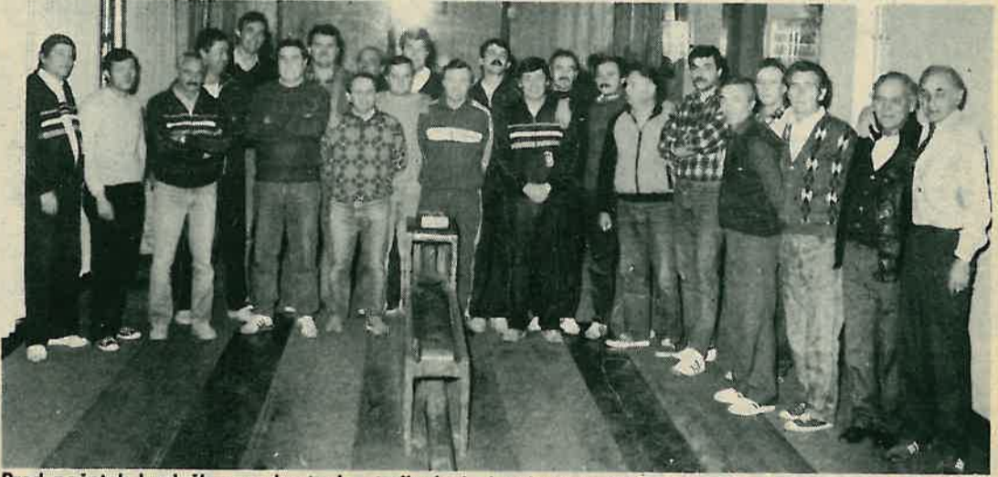
Pred početak kuglačkog nadmetanja starih rivala i pokretača RSI

Poslije podne održan je na dugoselskoj kuglani ponovo susret ekipa iz ta tri kolektiva. Najbolja, najprezicijna i najborebnija u tom nadmetanju bila je ekipa radnika »Kograpi«.