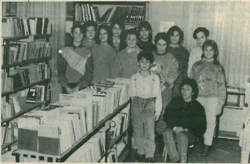
Mladi knjižničari na okupu