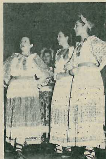
»Tančec« u bogatim i vrijednim nošnjama

Ako bismo donosili sud o organiziranosti, zajedništvu i povezanosti žena na području dugoselske općine na temelju održane ovogodišnje osmomartovske akademije, tada bismo mogli samo izreći da neka posebna svijest žena u tom smislu i ne postoji. Gotovo brojniji bijahu izvođači nego li gledaoci, i to bez obzira što je na razne adrese upućeno oko 500 poziva za tu akademiju. No oni koji su došli – nisu požalili. Osnova za takvu tvrdnju je relativno snažan i dug plesak upućen tridesetipetorci izvođača Hrvatskog kulturno-umjetničkog društva »Petar Zrinski« iz Vrbovca te KUD-u »Tančec« iz Nart Jalševca. Izborom narodnih pjesama i vrsnim izvodenjem uspjeli su »zapaliti«