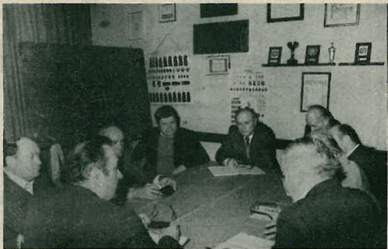
Koordinacioni odbor tri vatrogasna saveza