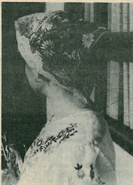
Sneja u poculici-svilom našitom