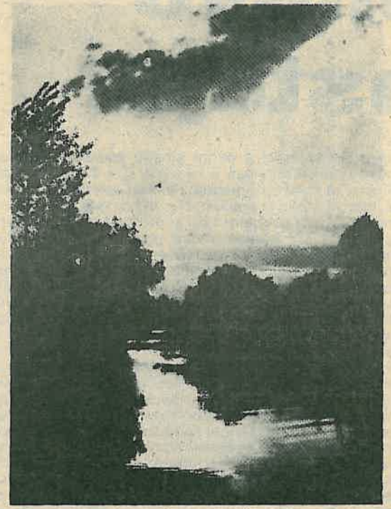
Naslovna strana sa vrijednom umjetničkom fotografijom Berislava Trnskog