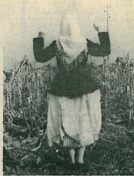
Duplana peča, obična cabajka i potprežena rubača