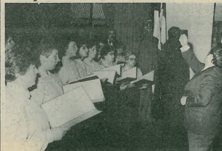
Ženski zbor HKUD »Petar Zrinski«

Izvođačima najviša ocjena, Dugoselcima kritika za propušteni glazbeni doživljaj.