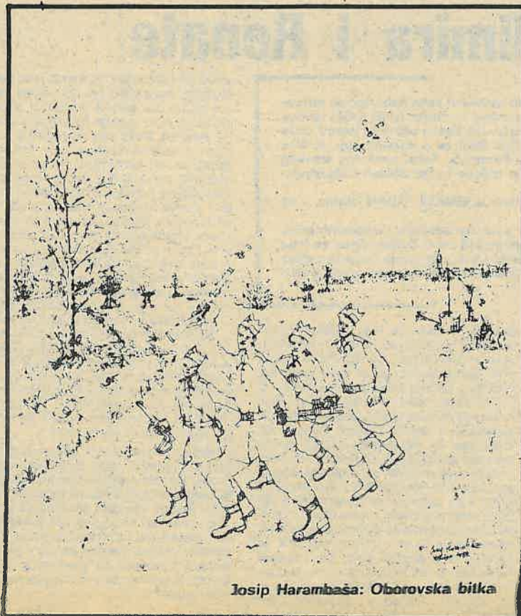
Josip Harambaša: Oborovska bitka

Ali kada su se, konačno, domogli ruba šikare, protrnuli su od još većeg užasa – pred njima se sada otvorila nepregledna ravnica, a samo tu i tamo uzdizao se poneki grm, osamljeno stablo vrbe, hrasta ili jasena. No još više su se zgrozili kada su zamijetili, na udaljenosti od dvjesto metara, nekoliko grupa kozačkih konjanika, koji su krstarili po čistini, zaljeujući se ovamo i onamo, u galopu – očito su tražili poginule ili ranjene partizane. Ponekad sad ovdje, sad ondje, iz ravnice bi dopro prasak puške, kratak rafal mitraljeza, čija bi se jeka razlijevala nad zemljom, zatumljujući u daljinama. Jedna grupa od tri konjanika, daleko stotinjak metara, odjednom se zaustavila, tako naglo da su se konji propeli na stražnje noge, a jedan od konjanika, s puškomitraljezom u rukama, skočivši s konja, pode naprijed, stane i uperi oružje u neku spodobu koja se micala na zemlji. Pogledavši od njih zapovijest, konjanik ispali rafal u spodobu na zemlji – ona se, prorešetana rafalom, propne, a onda opet stovrali na zemlju, smiri.