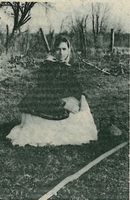
Žena u krizanini, plišnatoj cobajki i svilenom rupcu