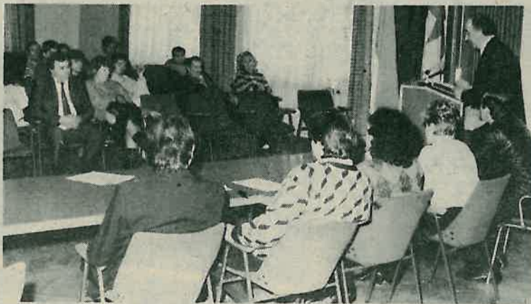
Sa skupštine »Dinamike«