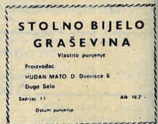
Etiketa za bocu – sjećanje na nekadašnju proizvodnju

No Mato nije napustio svoj vinograd. Jedan od ta dva je poklonio kćerki. On nam o to-