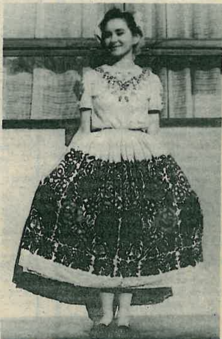
Tkano z vunom – iz novijeg vremena

lici bez peče i rupca , pa se reklo »na Antunovo v Jezevu, na Vidove pri Martinu i na Veliku i Malu Mešu u Nartu se su sneje bile gologlave« .