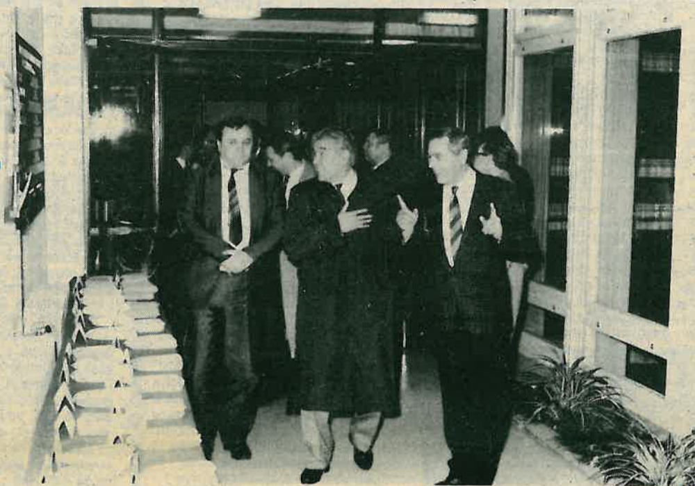
Posjeta Institutu za oplemenjivanje bilja u Rugvici

Ništa lakše nije ni u oblasti poljoprivrede. Najveće teškoće proizlaze iz nemogućnosti namirivanja kreditnih obaveza