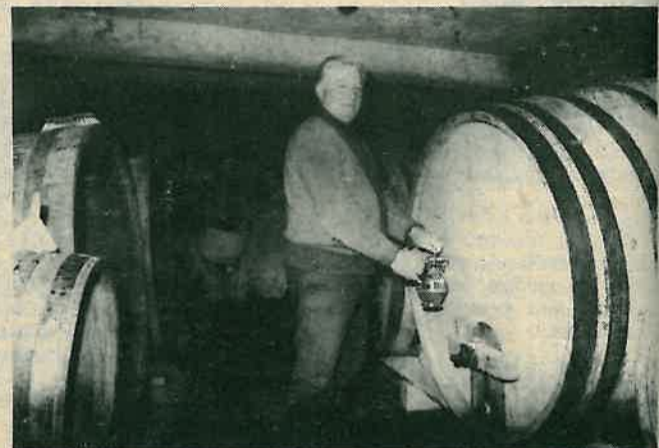
Mato u podrumu