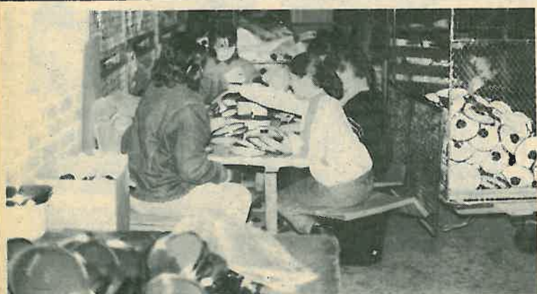
Mali radnici ozbiljno su shvatili svoje radne zadatke

Zadovoljstvo se oslikava u očima učenika — radnika. A kako i ne bi. Tretiraju se kao pravi radnici, osiguran im je topli obrok, a i za svoj rad primat će odgovarajuću naknadu. Individualno, stekli su još možda i prva saznanja, te vidjeli da lonac i nije tako lako proizvesti. Možda će vrijeme provedeno na radu u našoj tvornici motivirati nekog od njih da postane metalac, emajlirac, dizajner. Možda će željeti u našoj tvornici ponuditi neki drugi lonac. Hoće li netko od njih sutra ući u tvornicu kao mladi stručnjak, vrijeme će pokazati.