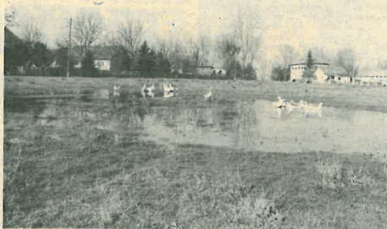
Leprovica i nezatrpana depresija kao korist za patke

Jedna, i to svakako manja dugoselska mjesna zajednica je Leprovica. To je staro selo kojega povijest nije štedjela od iznenadnih nadolazaka velikih nesreća. Danas je Leprovica niz uredno i u kontinuitetu poredanih kuća uz desni rub ceste Dugo Selo - Ježevo i oko 7 kilometara udaljena od općinskog središta. Tu danas prema vrlo preciznoj evidenciji o svakom stanovniku, koji su izradili sami ljudi u MZ, živi točno 211 stanovnika u točno 74 domaćinstva. Jedna trećina njih je u životnoj dobi iznad 60 godina. Na svoj način je i zanimljiv podatak da je u tom broju žitelja čak 41 udovica, dakle skoro svaki peti stanovnik. No ženike moramo malo obeshrabriti činjenicom da su gotovo sve one u životnoj dobi iznad 60 godina. Svaki četvrti stanovnik je zaposlen. U Leprovici žive 26 poljoprivrednika, a 31 učenik polazi osnovnu i srednju školu, a tu su i dva studenta. Prosječna životna dob stanovnika je vrlo visoka i ona više navija daljnje smanjivanje broja žitelja Leprovice nego li povećanje. Odmah po završetku rata tu je živjelo stotina domaćinstava, a danas za četvrtinu manje. Ovdje danas žive ljudi sljedećih prezimena: Plavić, Doroda, Rustambeg, Panjan, Muškon, Prosnec, Róbić, Klepac, Dakman, Pužek, Pajtek, Papa, Antol, Tečić i Špoljarec. Sva se ta domaćinstva, bez obzira da li u njima netko radi u prirodi ili neprivredni bave istodobno i poljoprivredom.