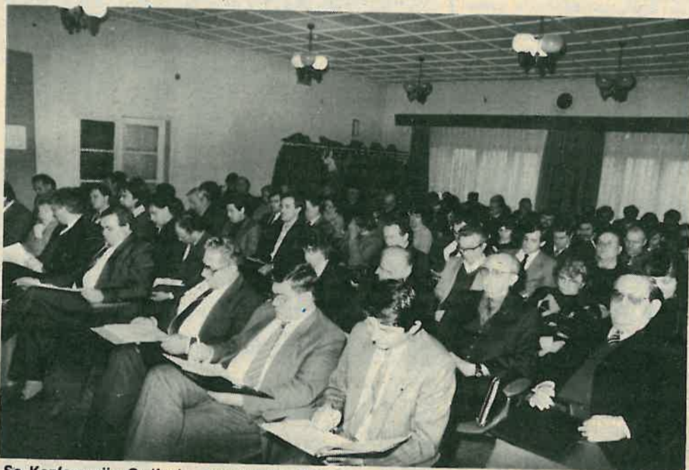
Sa Konferencije Općinske organizacije SK

S obzirom da Izvještaj o proteklom radu, program budućeg rada i sadržaj predviđene teme sadržajno prožimaju i nadovezuju o njima je vodena jedinstvena i cjelovita rasprava na temelju koje će Općinski komitet SKH utvrditi zaključke s kojima će biti upoznate sve osnovne organizacije SK, uz obvezu njihovog provođenja.