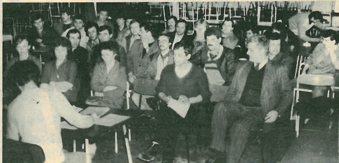
O zadacima Stambene zadruge vrlo ozbiljno

Postotak izvršenja plana za obrazovanje, osposobljavanje i usavršavanje radnika RO »Gorica« za 1987. godinu vrlo je visok, ali ipak nije zadovoljavajući. Obrazovanje i osposobljavanje jedan je od osnovnih uvjeta svih naših aktivnosti, osnova za sudjelovanje u samoupravnom procesu, u izvršavanju radnih zadataka i u ostvarivanju naših prava i obaveza. Posvetimo ovom području pažnju koju i zaslužuje!