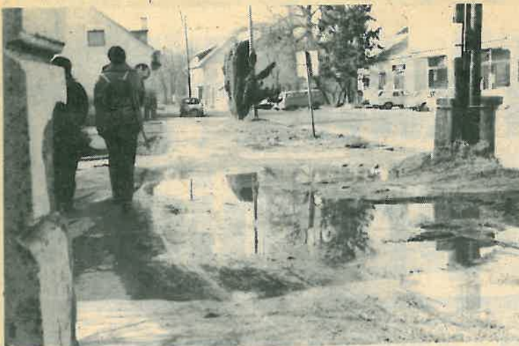
Ne samo kaljuža – uskoro i jezero