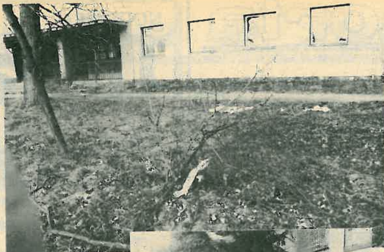
Smetište i ispred prve zgrade Općine